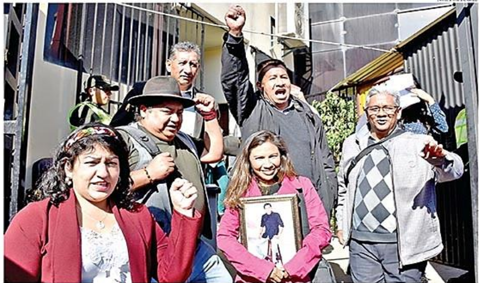
Sobrevivientes y familiares salieron emocionados de la audiencia desarrollada en el Tribunal Departamental de Justicia de Cochabamba.