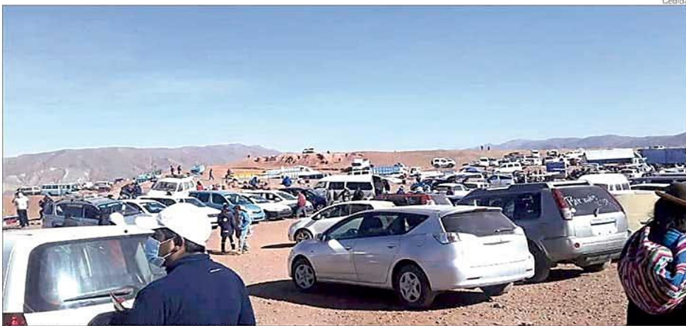
La oferta de autos indocumentados crece en las ferias de Potosí.

➤ El transporte sindicalizado potosino rechaza esa propuesta porque traerá problemas a su sector y no descartan acciones con otras organizaciones. A-6 y 9