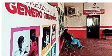
Autoridades y técnicos trabajan en un proyecto para reducir los indicadores de violencia

Acción. Las autoridades locales con el apoyo de instituciones externas, buscan los mecanismos para reducir los índices de violencia PÁG. 3