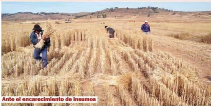
Ante el encarecimiento de insumos