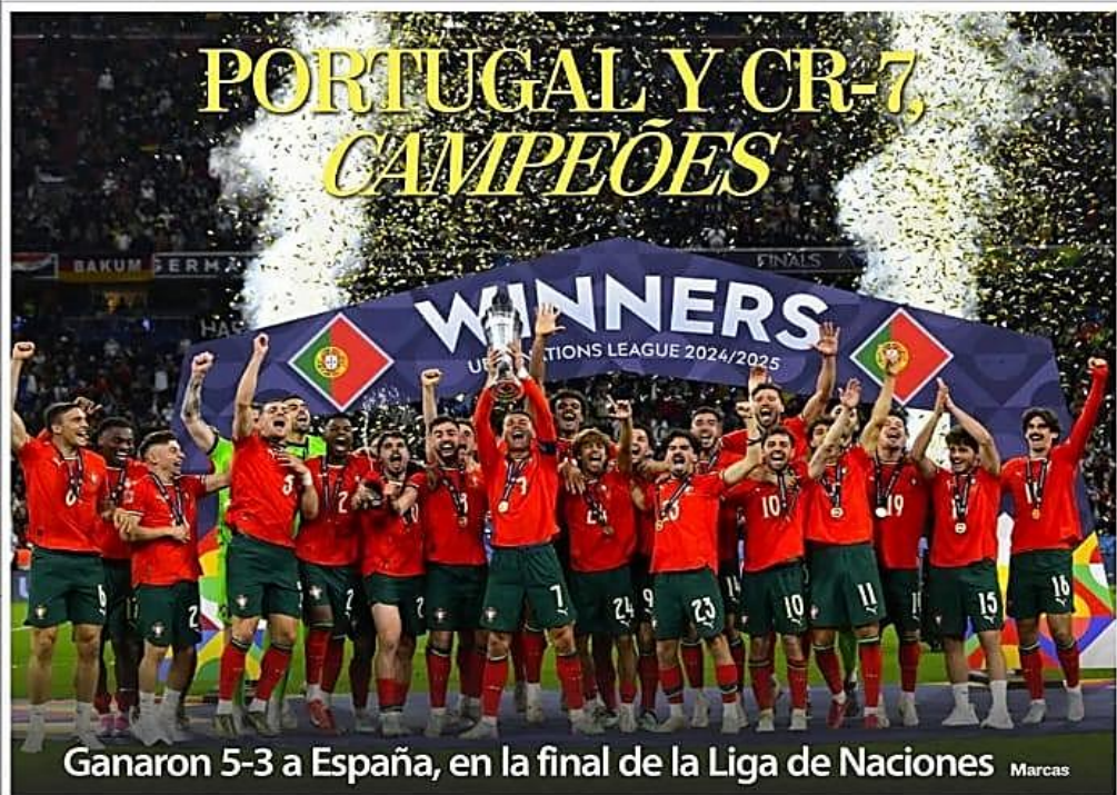
Ganaron 5-3 a España, en la final de la Liga de Naciones Marcas