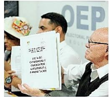
Del total de los inscritos a la C-57, 16 fueron inhabilitados.

Cambio. Los restantes siete frentes que aún no inscribieron candidato a la C-57, tienen plazo para hacerlo hasta el 14 de agosto. PÁG 5