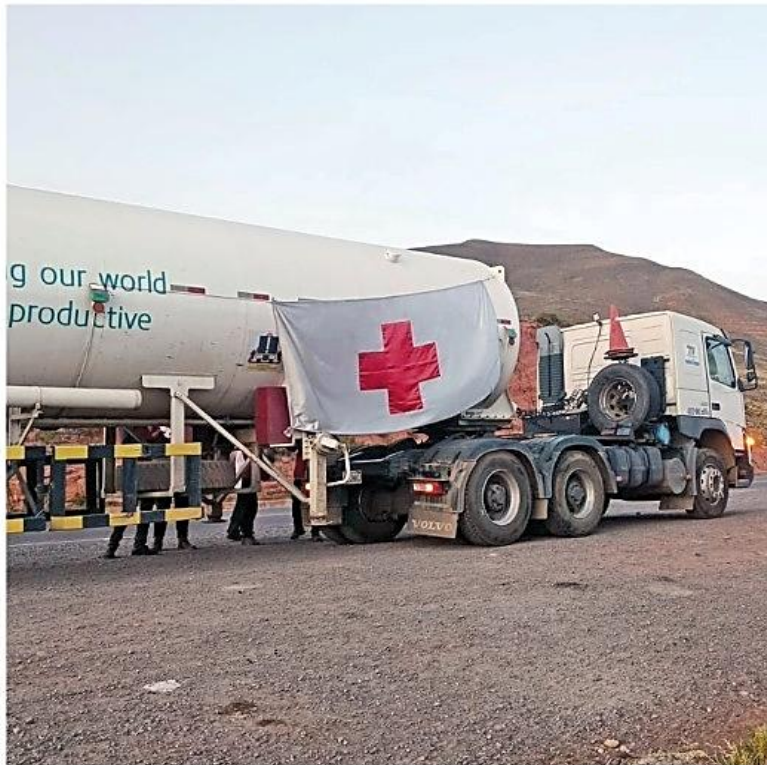
APOYO. Voluntarios de la Cruz Roja escoltaron una cisterna con oxígeno medicinal que se dirigía este domingo a Potosí.

» El Servicio Departamental de Salud anunció la elaboración de un plan de emergencia para garantizar el suministro. A/ 6