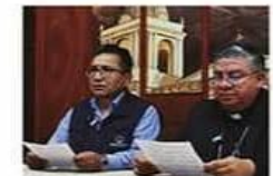
La Iglesia y la Defensoría del Pueblo continúan a buscar el diálogo

Pese a la negativa de los dirigentes de los sectores movilizadas, no ven otro camino de solución que no sea el diálogo NACIONAL PÁG 4