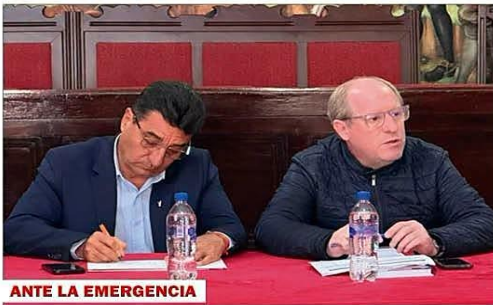
ANTE LA EMERGENCIA