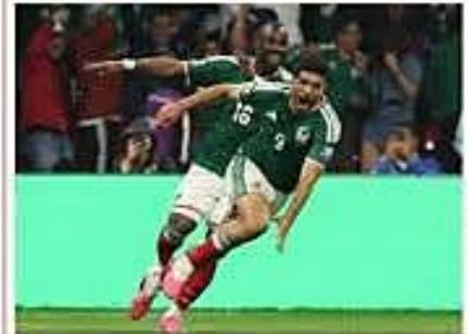
El seleccionado mexicano pudo ganar el partido de 16avos de final, apoyado por sus hinchas en el Estadio Azteca Pág. 111