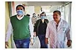
El hospital debe pasar a tuición total de la Gobernación cruceña

Las autoridades de Salud nacionales y departamentales trabajan en acelerar la entrega del nosocomio montereño CIUDAD PÁG 3