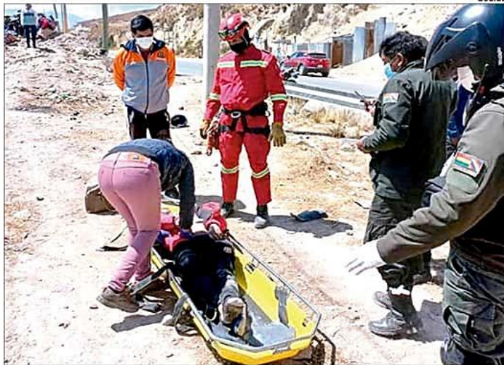
Personal de bomberos rescata el cuerpo de un minero fallecido.

► En las últimas horas, tres varones perdieron la vida al caer a profundas galerías y otro fue sepultado por una carga de mineral. ► Al inicio del tercer mes del año ya hay 42 muertos, una cantidad elevada si se la compara a cifras de gestiones pasadas. A-7