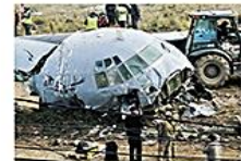
El accidente del avión Hércules dejó un saldo fatal de 22 muertos