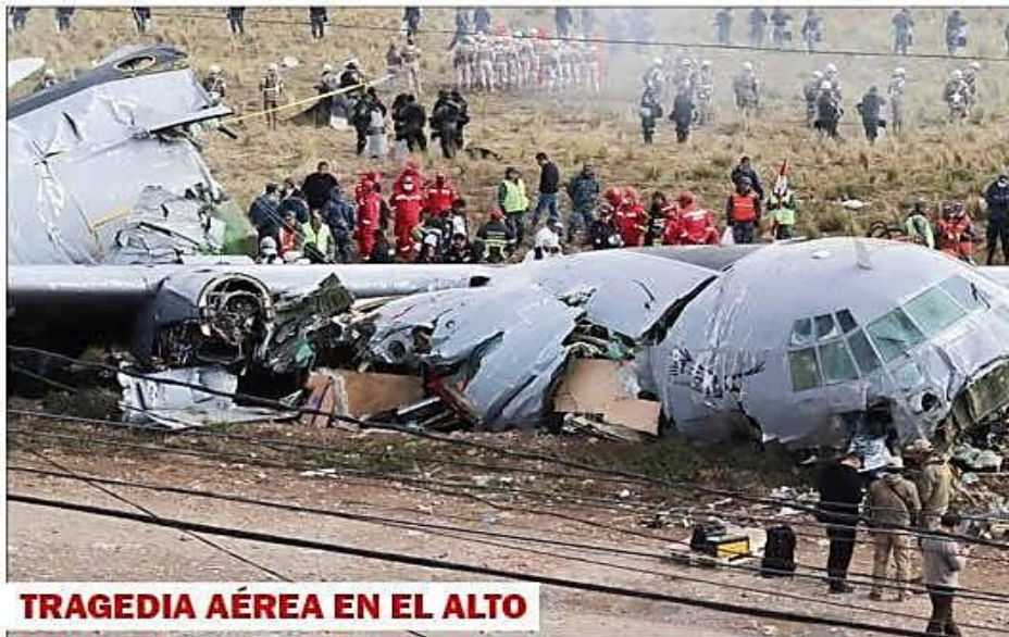
TRAGEDIA AÉREA EN EL ALTO