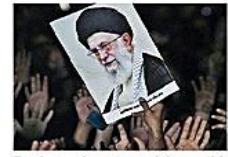
Duelo por la muerte del ayatolá

remover tierra en busca de billetes. El Gobierno decretó tres días de duelo. ECONOMÍA 2A