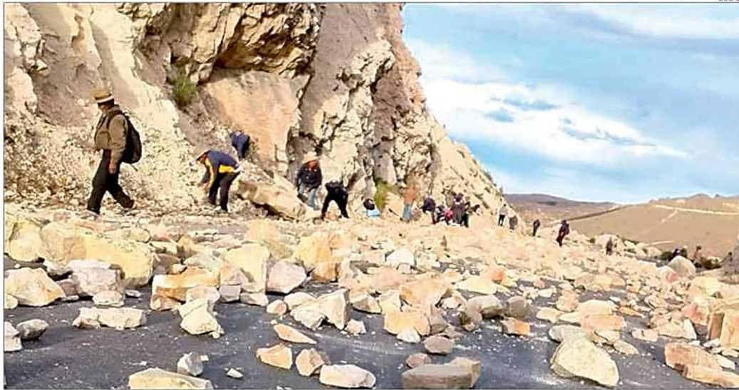
Uno de los bloqueos vigentes en el territorio nacional.

► Ayer se conoció que el acuerdo establece que, a cambio, Israel frenará la ofensiva militar que desarrollaba en el Líbano. A-12