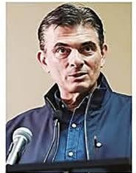
El mandatario se resiste a cumplir con el pedido de declarar estado de excepción

Decisión. A 33 días del bloqueo de carreteras, el presidente del país insiste en que buscar la salida al conflicto mediante el diálogo