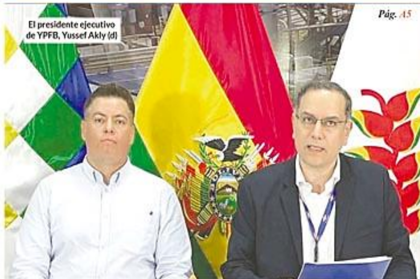
El presidente ejecutivo de YPFB, Yussef Akly (d)