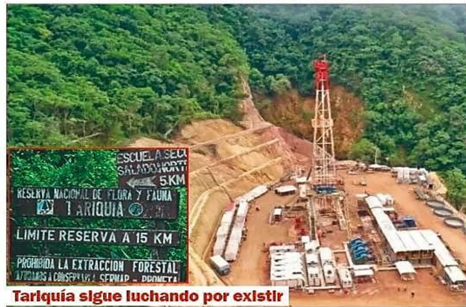
Tariquí sigue luchando por existir