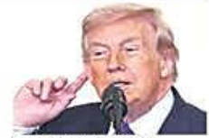
EEUU redobla ataques

Entretanto, la Policía capturó a 51 personas supuestamente involucradas en el robo de billetes. TEMA DEL DÍA A 2-4