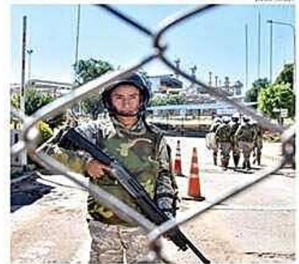
Militares apostados en la refinería Gualberto Villarroel, de Cochabamba.