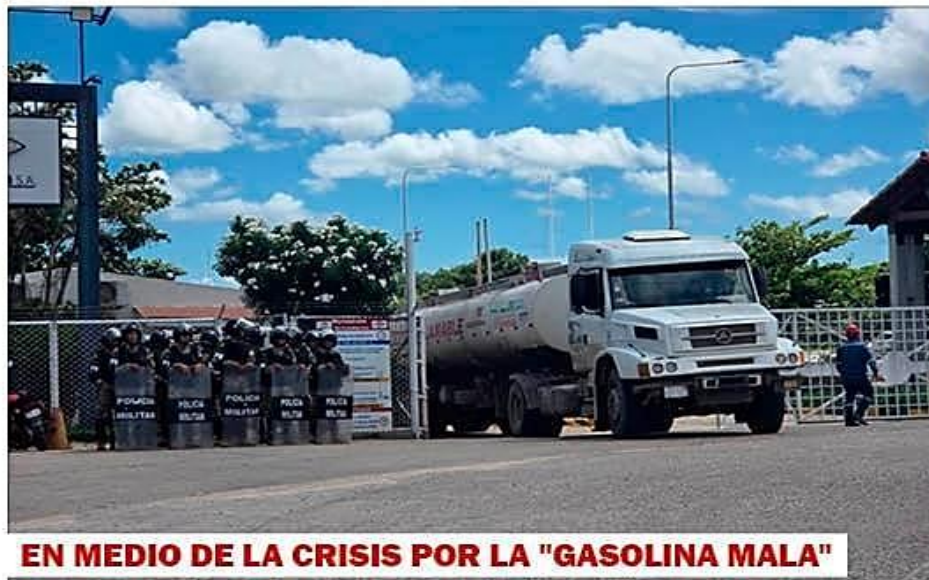
EN MEDIO DE LA CRISIS POR LA "GASOLINA MALA"