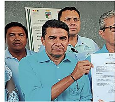
Son 254 las candidaturas a punto de quedar inhabilitadas

Reacción. La cúpula directiva de Asip, apela la determinación, por no haber logrado el 3% de los votos en las últimas elecciones regionales. PÁGS 6