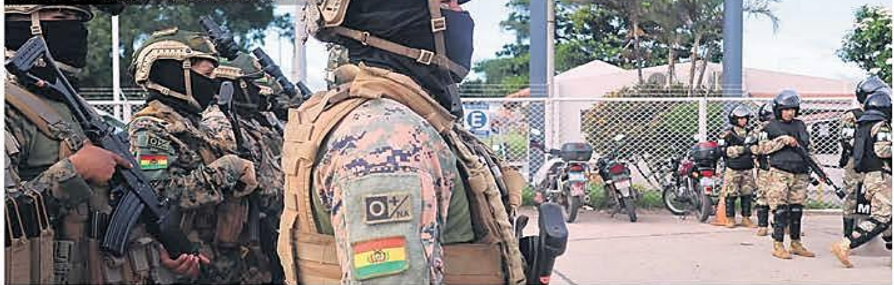
JUAN CARLOS TORRES/LA

Según el presidente Rodrigo Paz, el problema con la gasolina 'desestabilizada' fue parte de un sabotaje en la estatal petrolera. PÁG. 5