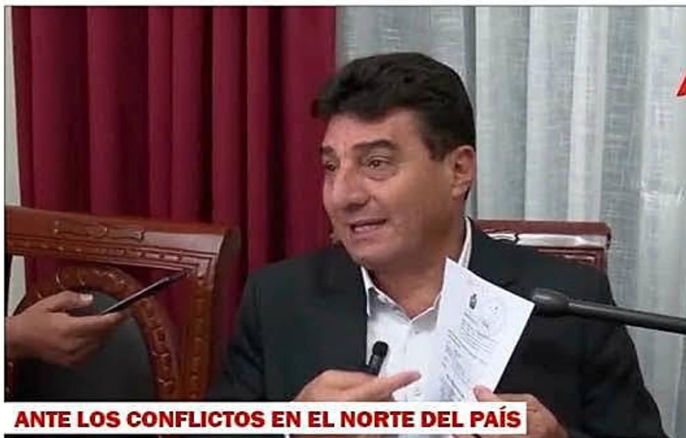
ANTE LOS CONFLICTOS EN EL NORTE DEL PAÍS