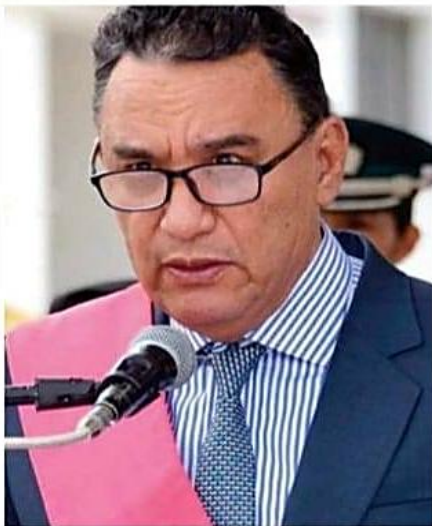
▶ Salinas y García dimiten de sus cargos