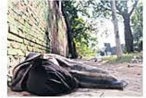
Calles convertidas en dormitorios

mandan que el presidente Rodrigo Paz despeje las vías. Hay cambios en el gabinete, por renuncias en los ministerios de Defensa y de Educación. A2-5