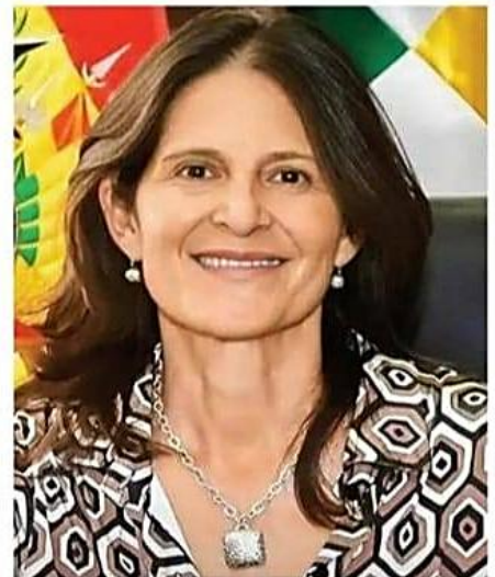
▶ El país entra a los 34 días de movilizaciones