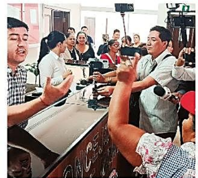
Gente extraña al Concejo increpó a los funcionarios ediles

Denuncia. Funcionarios del Concejo denunciaron acoso laboral por parte de los ediles opositores tras darse una bochornosa discusión. PÁG 3