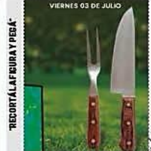
RECORTA LA FIGURA Y PEGA

La Policía reactivó los controles en la zona, tras varias denuncias de asaltos. Repartidores en moto ingresaron al lugar pero fueron amenazados SEGURIDAD A7