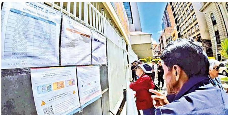
La fila de personas que acuden al Banco Central a intentar canjear los billetes de Bs 10, 20 y 50 de la serie B, en La Paz.