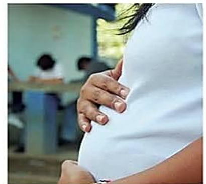
En 2025 se contabilizaron más de 200 alumbramientos

Medidas. Se pide trabajar más en la prevención y en los mecanismos de información hacia las adolescentes, educadores y progenitores. PÁG 3