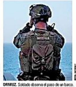
ORMUZ. Soldado observa el paso de un barco.

Estados Unidos escoltará barcos en el estrecho de Ormuz