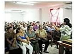
La capacitación a las mujeres se llevó a todos los distritos urbanos

La Alcaldía de Montero con el apoyo de la ONU Mujeres y Koica, realizó los talleres para promover emprendimientos. CIUDAD PÁG 4