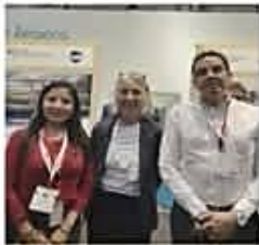
[6] Economía y empresa

[6] Economía y empresa El Gobierno activa reporte diario de combustibles