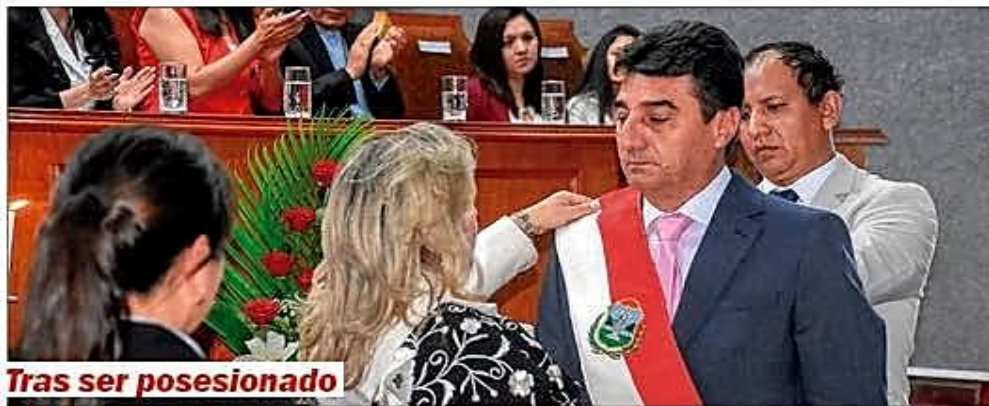
Tras ser posesionado