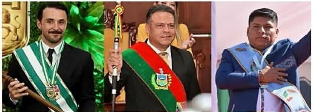
[4] Economía y empresa

▶ Trabajo dispone tolerancia para este martes ante anuncio de las medidas del transporte