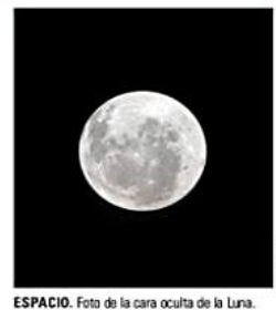
ESPACIO. Foto de la cara oculta de la Luna.

» La misión espacial volará sobre la cara oculta de la Luna