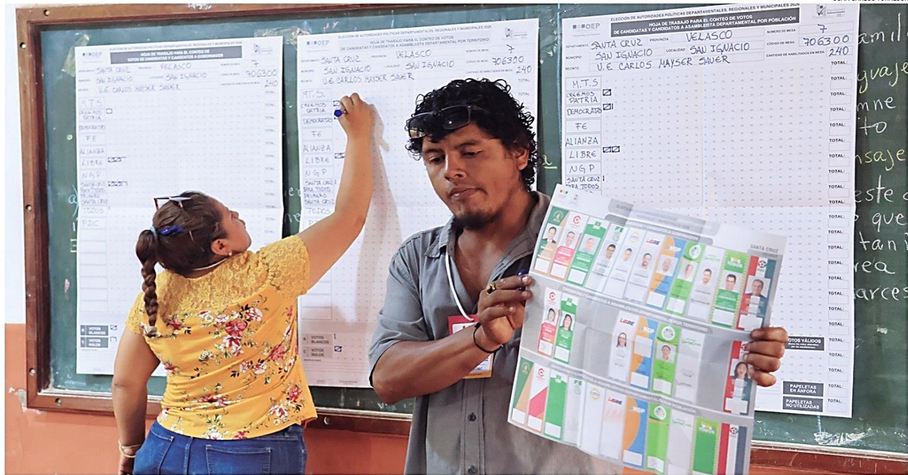
CONTEO PRELIMINAR. Los ignacianos acudieron a votar sin necesidad de aplicar el Auto de Buen Gobierno. La elección municipal no se repitió, pese a cuestionamientos.