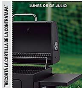
RECORTA LA CARTILLA DE LA CONTRAPÁ

El Ministerio Público recibió al menos cuatro demandas contra el expresidente, por impulsar bloqueos que afectaron 53 días al país PAÍS A5