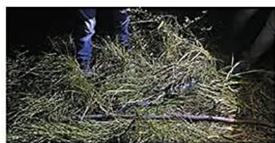
Los amigos de lo ajeno estaban armados al momento de ingresar a la propiedad

Investigación. La Policía reportó que hubo un enfrentamiento entre los abigeatistas y el casero e indaga cómo se dio la muerte PÁG 5