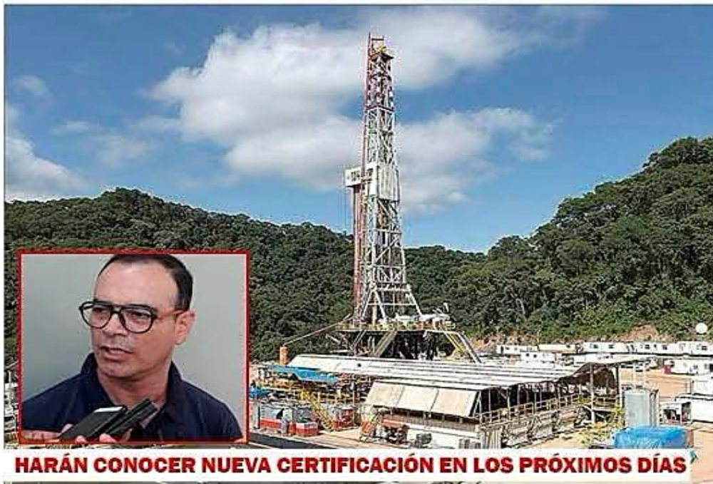
HARÁN CONOCER NUEVA CERTIFICACIÓN EN LOS PRÓXIMOS DÍAS