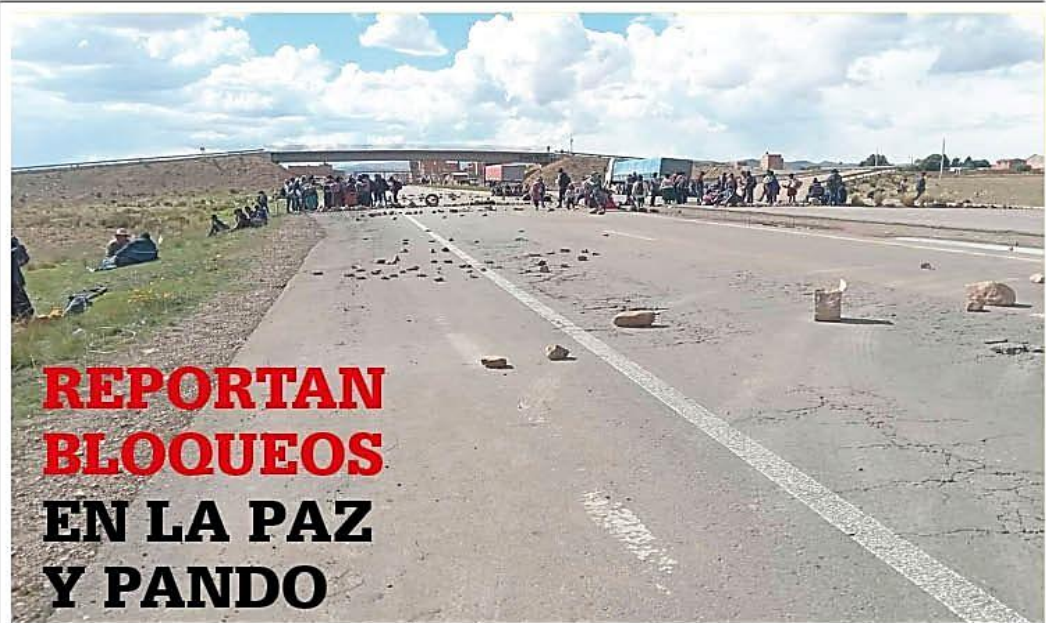
Las acciones de fuerza obligaron a suspender la salida de buses de las terminales. Son consecuencia del Instructivo de la COB que se ha propuesto lograr la derogatoria del Decreto Supremo 5503.