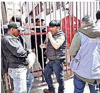
Policias requirieron un residencial de la COB y generaron alarma, en La Paz.

Alcaldía prevé hasta 6 mil vehículos por hora