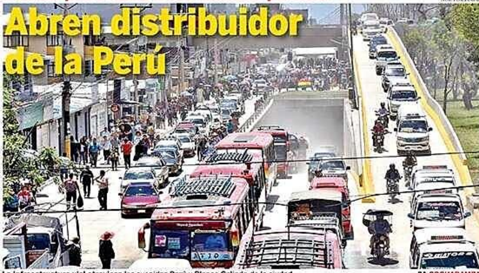
La Infraestructura vial atraviesa las avenidas Perú y Blanco Galindo de la ciudad.