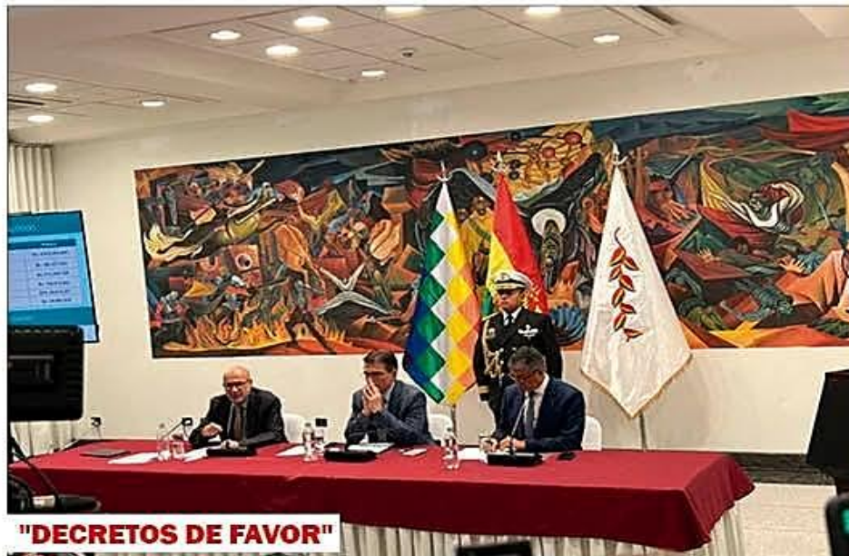
"DECRETOS DE FAVOR"