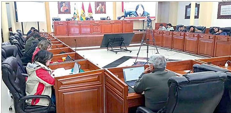
Una sesión de la Asamblea Legislativa Departamental.

► Se convocó a sesión ordinaria de hoy en la que se verá la renuncia del titular de la gobernación y se analizará la continuidad de Copa u otra opción. A-8