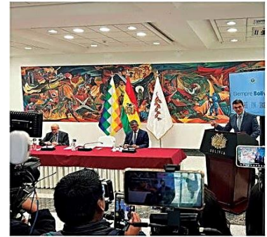
Paz asegura que avanza en eliminar el Estado 'trunca cloaca'

Denuncia. Según las autoridades de Gobierno los contratos sin licitación se utilizaban para beneficiar a gente del entorno de las gobernantes. PÁG 7