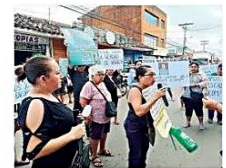
Los protestantes aseguran que la mujer es cómplice del asesino