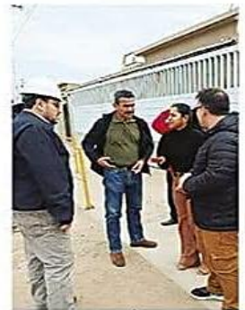
Los concejales conminan al Ejecutivo a que haga cumplir las leyes y revierta

Oficial. El Gobierno municipal de Montero anunció que adoptará los mecanismos que sean necesarios para recuperar predios del PAIN