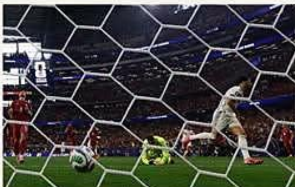
La eliminación de los lusos marca la despedida de Cristiano Ronaldo de su selección