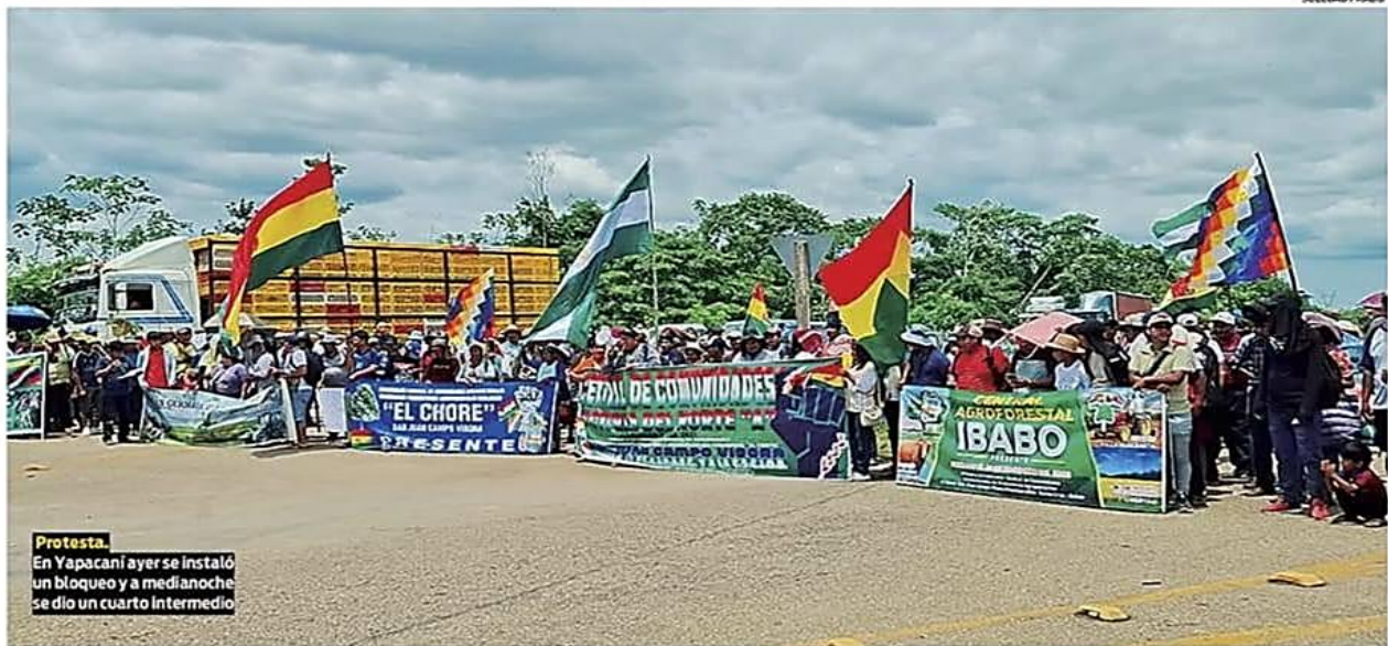
Protesta. En Yapacaní ayer se instaló un bloqueo y a medianoche se dio un cuarto intermedio

Los municipios rechazan la imposición de limitar el uso de recursos a solo un 20% AL CIERRE PÁG 7