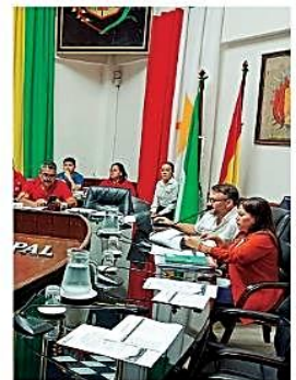
Los concejales de Creemos se basan en el nuevo reglamento para sesionar

Jornada. La convocatoria lanzada por la MAEC del Concejo no tuvo la asistencia del bloque opositor y se volvió a convocar para este viernes