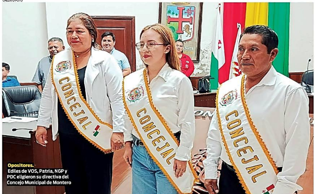
Opositores. Ediles de VOS, Patria, NGP y PDC eligieron su directiva del Concejo Municipal de Montero