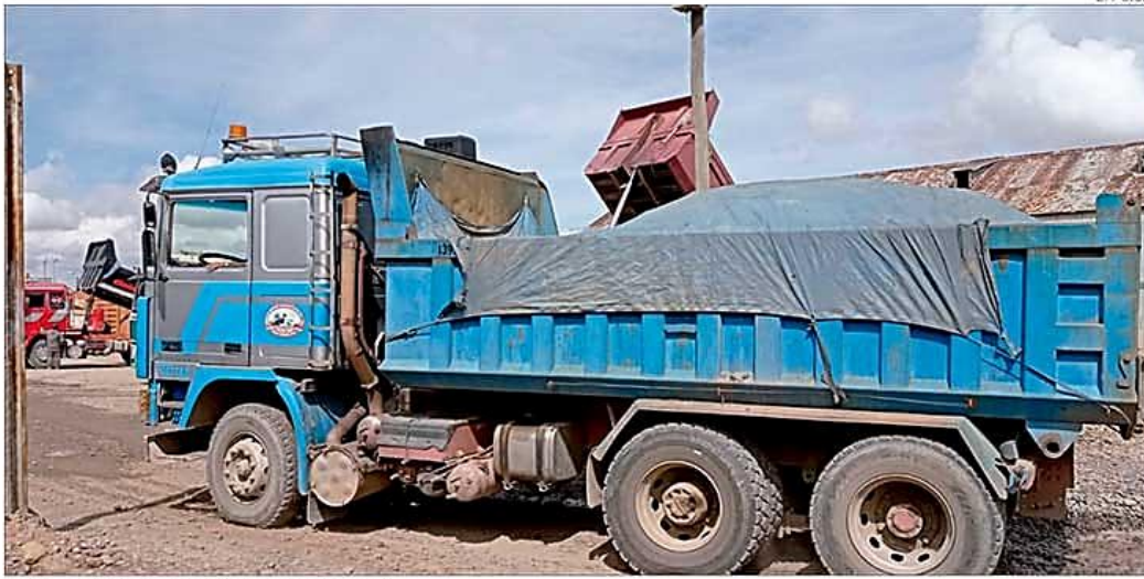
Un camión traslada los concentrados de mineral para su exportación.