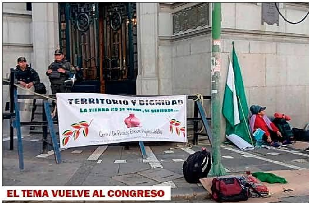
EL TEMA VUELVE AL CONGRESO