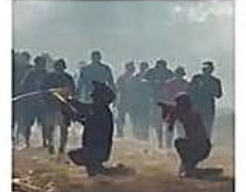
Encapuchados difundieron un video tras los operativos en San Julián

La advertencia que lanzó un grupo de personas armadas en contra de los policías, militares y sus familias, confirma la teoría del Gobierno NACIONAL PÁG 6