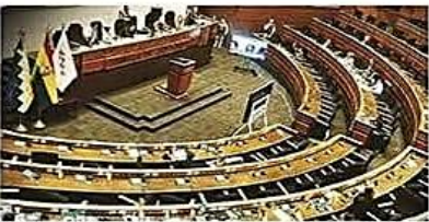
La ley que reglamenta los estados de excepción fue aprobada en Diputados

Norma. Parlamentarios de Libre y Unidad reclaman al presidente Rodrigo Paz que se promulgue la ley y se ponga en ejecución Trámite. El Gabinete espera la convocatoria del mandatario para analizar su aplicación y Evo Morales, dice que Paz tiene miedo. PÁG 5