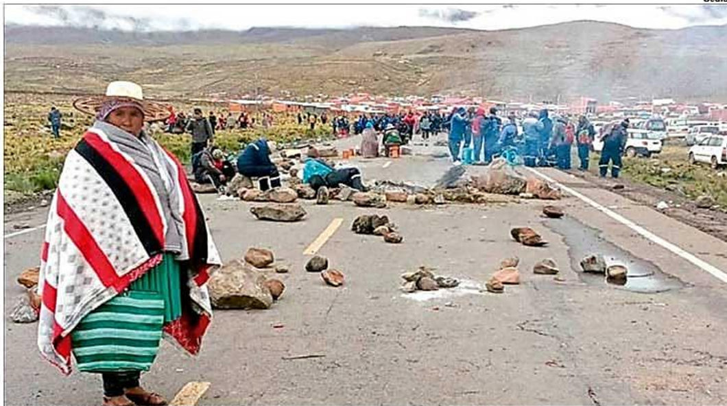
Uno de los puntos de bloqueo sobre la Diagonal Jaime Mendoza.

Autodenominadas "milicias armadas del pueblo" lanzan fuertes amenazas