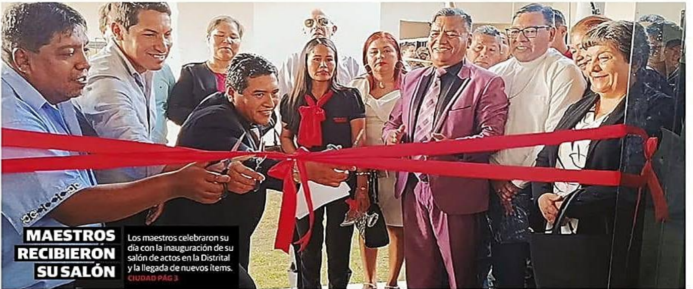
MAESTROS RECIBIERON SU SALÓN Los maestros celebraron su día con la inauguración de su salón de actos en la Distrital y la llegada de nuevos items. CIUDAD PÁG 3