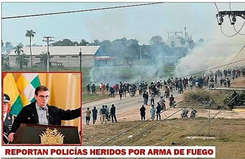
REPORTAN POLICÍAS HERIDOS POR ARMA DE FUEGO