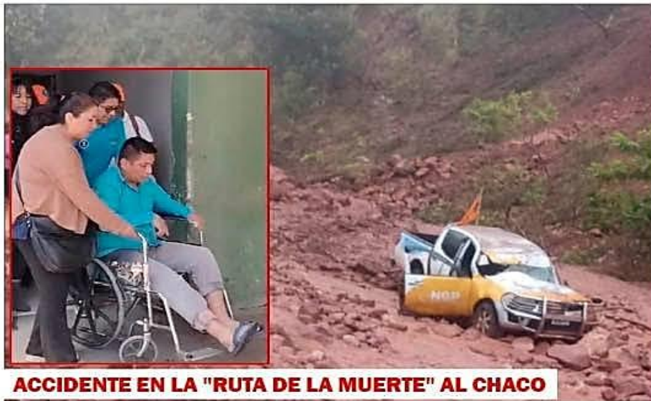
ACCIDENTE EN LA "RUTA DE LA MUERTE" AL CHACO