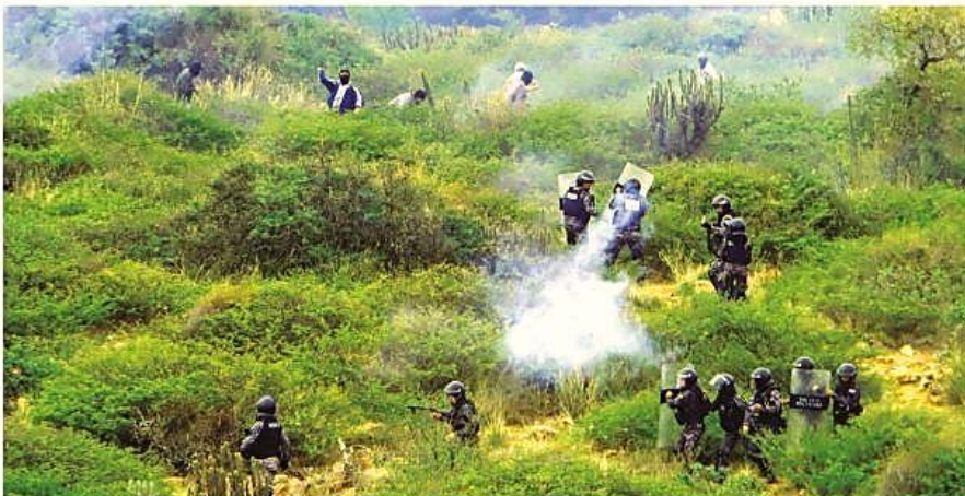
Personas con el rostro cubierto del sector de Cotapachi se enfrentan a la Policía que iba a desbloquear el botadero de Colcapirhua.

Violencia. Policías y pobladores de Cotapachi, en Quillacollo, se enfrentaron tras 12 días de bloqueo del vertedero. El vicepresidente Lara pidió una investigación. Pág. 6