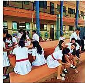
Las unidades educativas cierran el año escolar con buena nota

Tareas. Los educadores apuntan a dar mejores condiciones de enseñanza a los escolares del sistema especial y así tengan similares oportunidades. PÁG 3