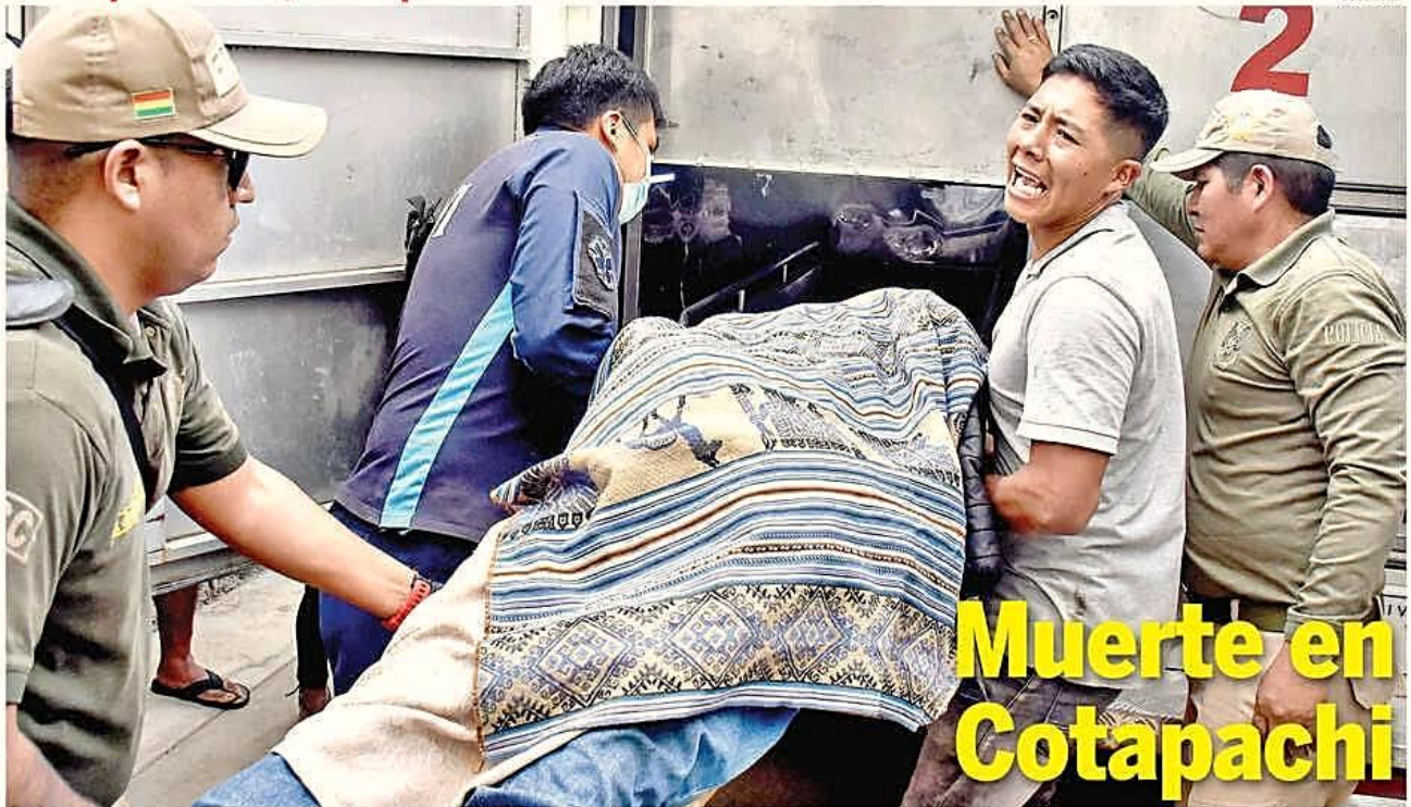
La violencia al calor del desbloqueo del botadero derivó en el deceso de dos comunarios. Sus familiares lanzaron denuncias.