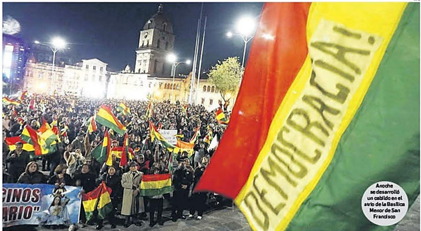
Anoche se desarrolló un cabildo en el atrio de la Basílica Menor de San Francisco

Unidas presentó una acción popular "para que se afronte la conmoción interna". El Gobierno anuncia una respuesta "con legalidad". A-3