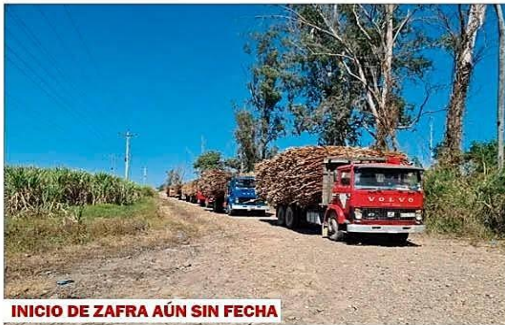
INICIO DE ZAFRA AÚN SIN FECHA