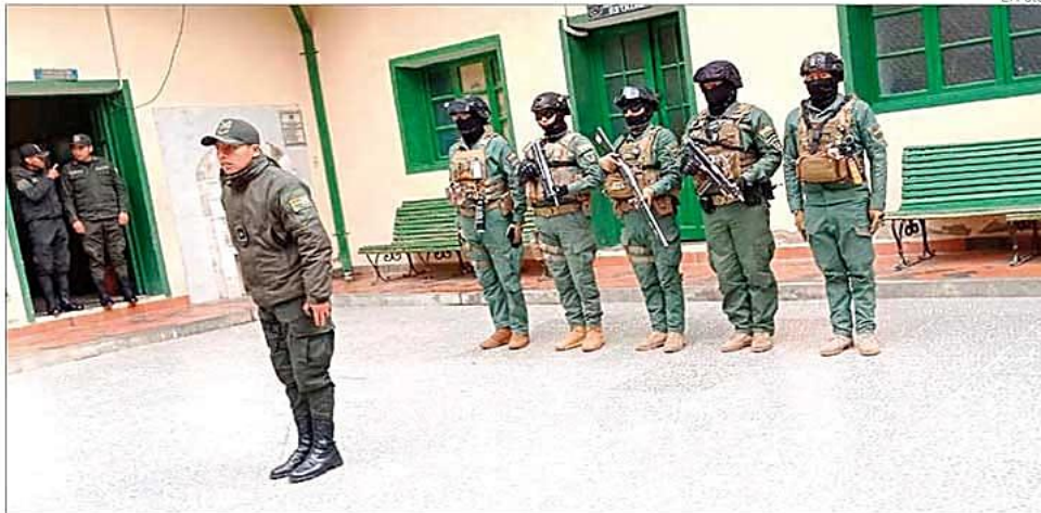
Los policías estarán bien armados para enfrentar la delincuencia.

► Las bandas delictivas dejaron millonarias pérdidas a los productores de minerales y ya causaron la muerte de un sereno, además de varios heridos. A-7