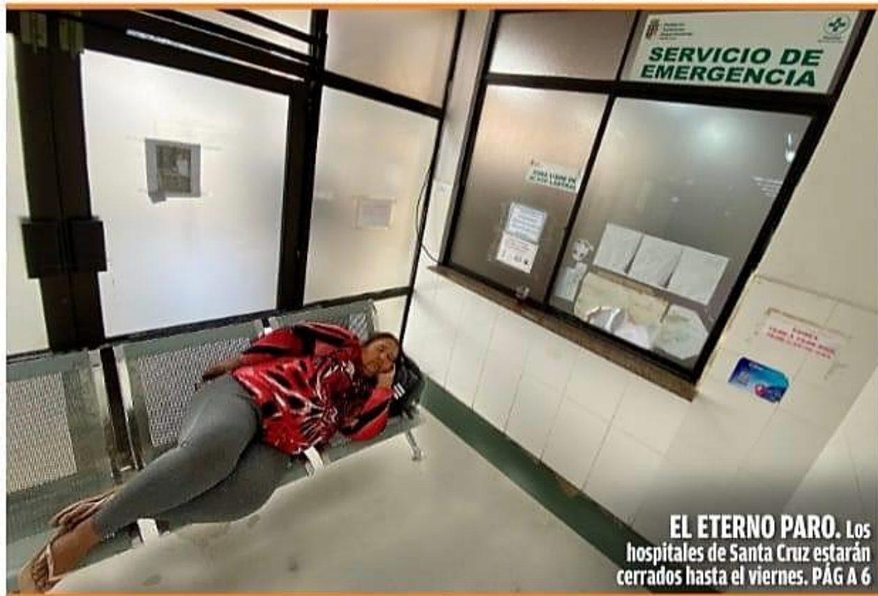
EL ETERNO PARO. Los hospitales de Santa Cruz estarán cerrados hasta el viernes. PÁG A 6

El uniformado, herido durante un operativo en el botadero de Cotapachi, el lunes pasado, fue aprehendido luego de admitir que usó su arma de fuego pese a la prohibición vigente en casos de manifestaciones y protestas ciudadanas. El hecho dejó dos comunarios muertos y 19 personas heridas. Autoridades, incluyendo fiscales y viceministro de Régimen Interior, inspeccionan la zona para esclarecer responsabilidades, mientras la Fiscalía investiga porte ilegal de armas, asociación delictuosa y homicidio en medio del conflicto ocurrido en el municipio de Colcapirhua. PÁG A 5