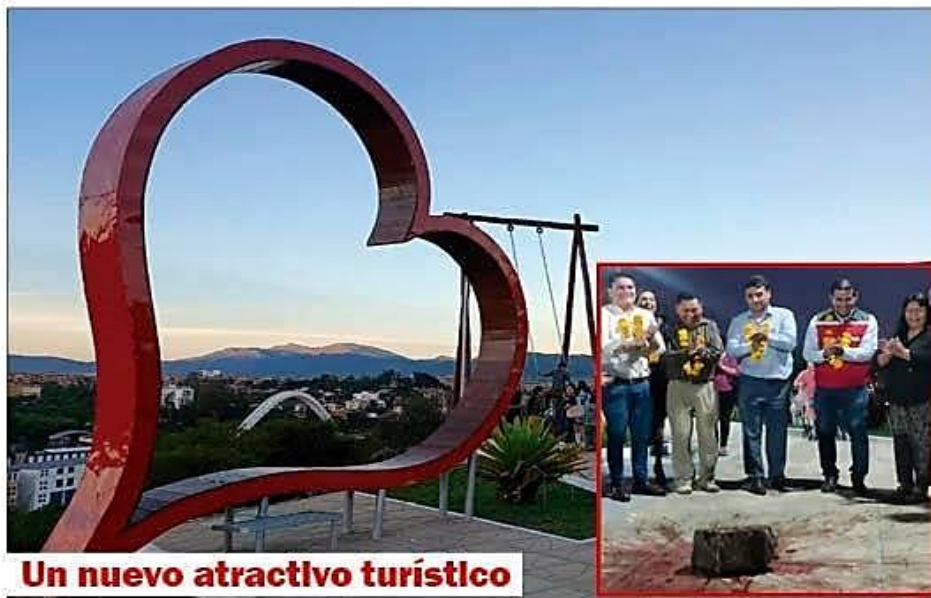
Un nuevo atractivo turístico