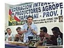
Los productores dieron plazo de 72 horas para cumplir el acuerdo

El compromiso del Gobierno de abrigar el Decreto Supremo 5547, permitió suspender la medida de los productores. REGIÓN PÁGS 7