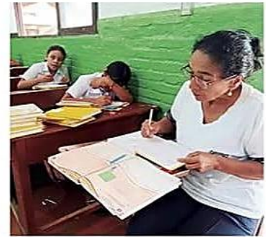
Muchos de los educadores, son pagados por los padres

Solicitud. La Distrital de Educación hizo el requerimiento formal de los 104 ítems al Ministerio, con el objetivo de reducir el déficit histórico que se tiene