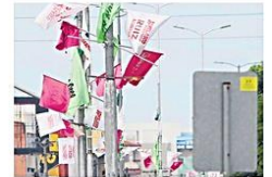
Persiste la contaminación visual

set, que fue capturado el 13 de abril y expulsado a Estados Unidos. El lugar contaba con siete habitaciones y varios lujos. A5