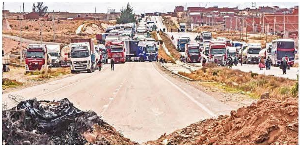
Decenas de camiones varados por la obstrucción de la vía en Urujara, salida de La Paz a los Yungas, ayer.

Desabastecimiento. La FAB transportó 10 t de carne de pollo a El Alto. Pág. 3