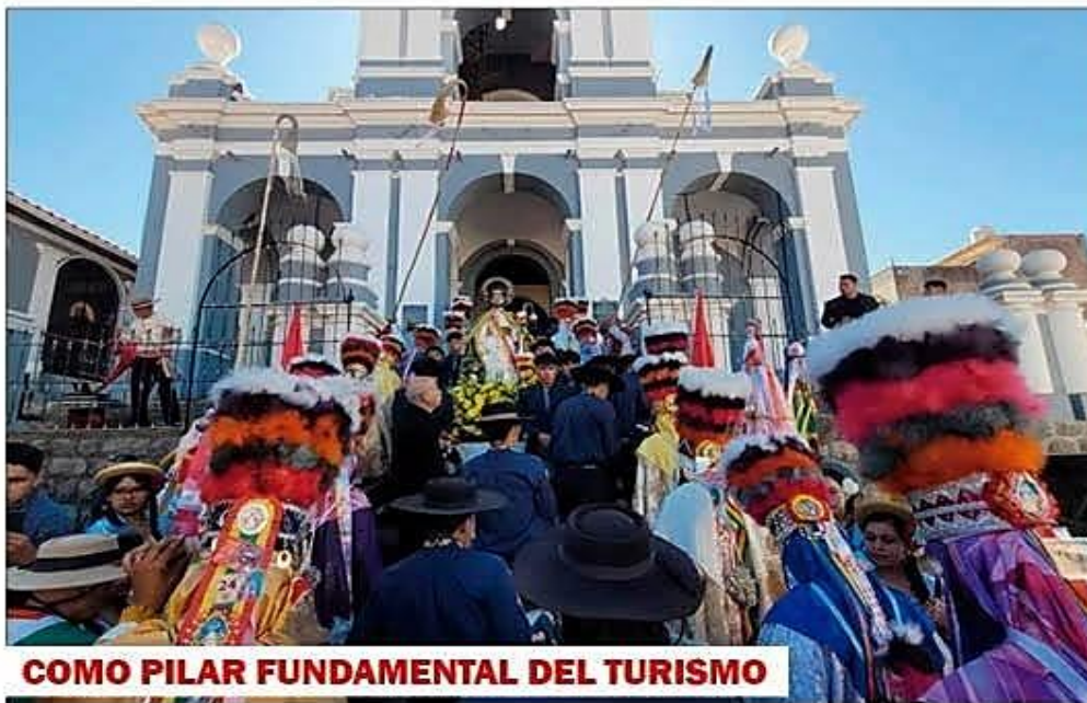
COMO PILAR FUNDAMENTAL DEL TURISMO