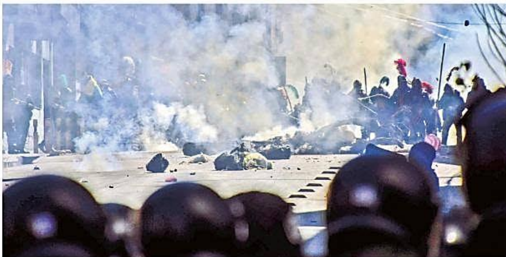
Duros enfrentamientos entre grupos de choque de la marcha contra el Gobierno y la Policía en el centro paceño, ayer.