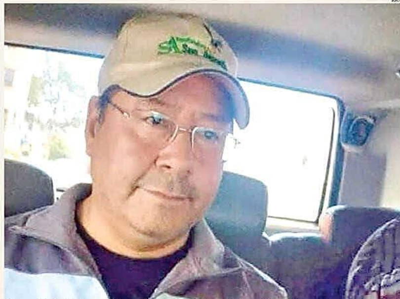
El expresidente Luis Arce, en el momento de su detención y traslado a celdas policiales.