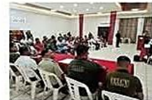
sdifdsfgdsfgds asdf dsaf df dsf ads fadsf dsf dsfds

En la rendición de cuentas pública la Felev reveló que se atendieron un alto grado de índices de violencia. CIUDAD PÁG 3