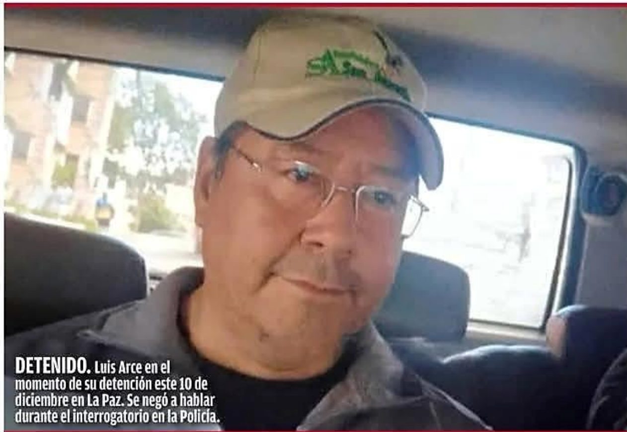
DETENIDO. Luis Arce en el momento de su detención este 10 de diciembre en La Paz. Se negó a hablar durante el interrogatorio en la Policía.