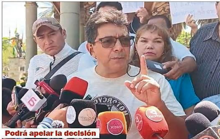
Podrá apelar la decisión