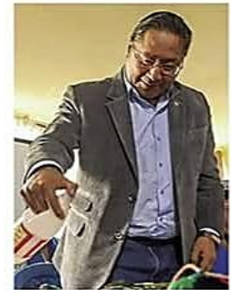
El ex mandatario pasó su segunda noche en las celdas de la Felcc

Proceso. El acta oficial de una reunión organizada en 2009, es el pilar de las acusaciones del Gobierno contra el ex mandatario