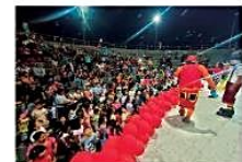
Agasajo la jornada de ayer los niños fueron agasajados en su Día

Los derechos de los niños se vulneran con mayor frecuencia en el mismo entorno familiar y social del menor CIUDAD PÁG 3