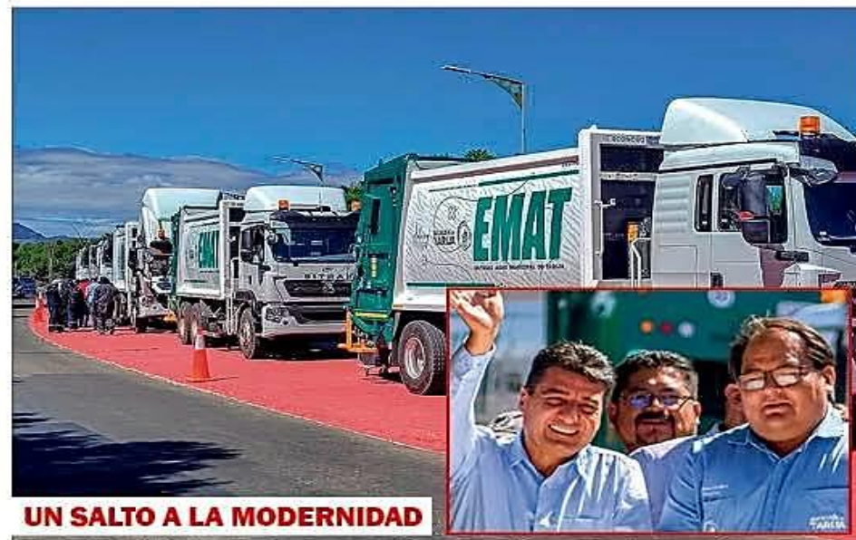
UN SALTO A LA MODERNIDAD