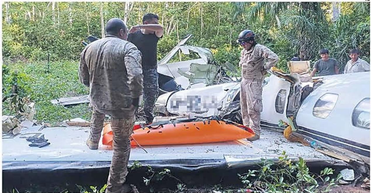
FATALIDAD. La aeronave siniestrada y los cuerpos de los pilotos fueron encontrados tras varios sobrevuelos, en un área de difícil acceso por tierra en Cochabamba

partamento de Cochabamba. Investigan las causas del infortunio. Una de las hipótesis es una pérdida de oxígeno en la cabina. A3-3