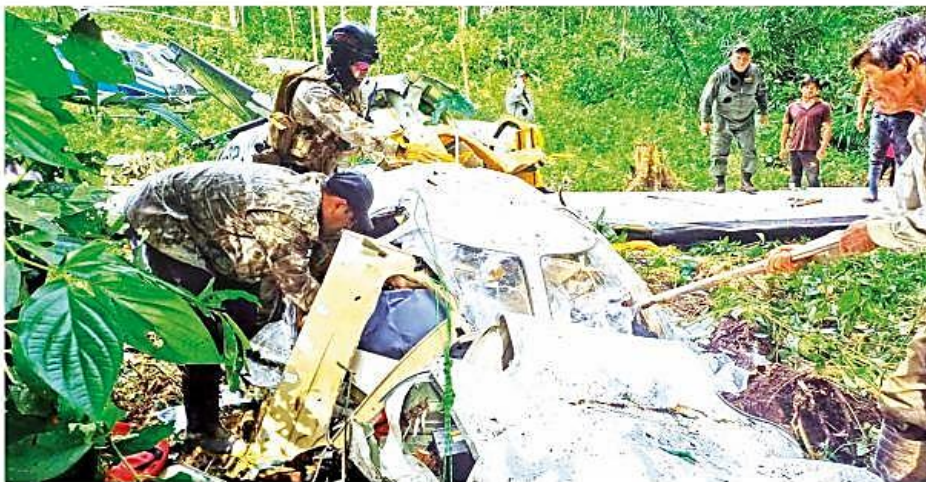
La aeronave Cessna Citation matrícula CP-3243 siniestrada ayer en la zona de San Miguelito, al norte de Villa Tunari, quedó destrozada.