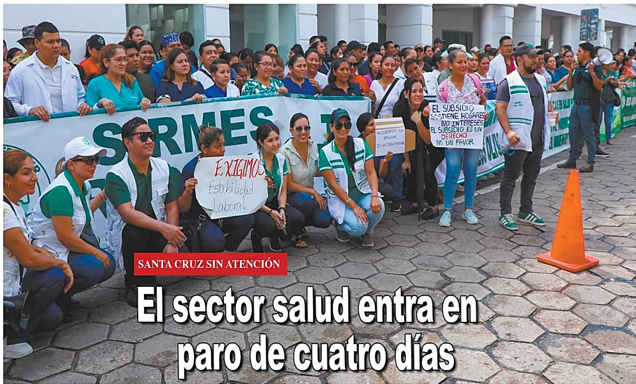
SANTA CRUZ SIN ATENCIÓN