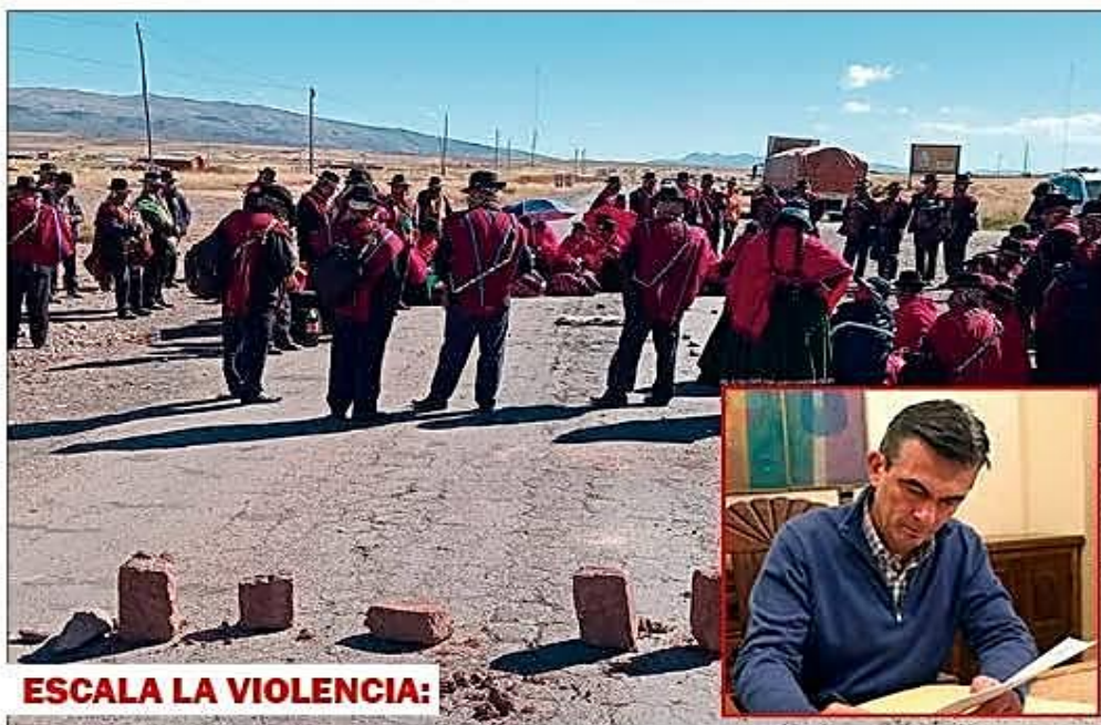
ESCALA LA VIOLENCIA: