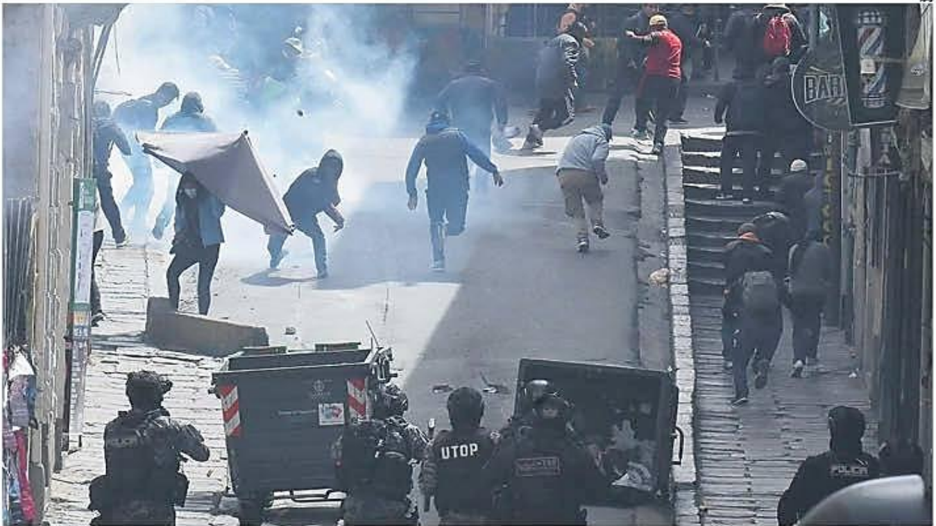
MANIFESTACIONES. La Policía y los maestros rurales se enfrentaron ayer en La Paz. Las protestas persisten, pese a que la Ley 1720 fue abrogada anoche por el presidente Paz