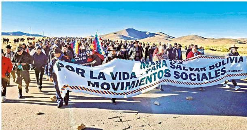
La marcha del sector evista que se dirige a la sede de Gobierno tiene previsto llegar el próximo viernes y sumarse las movilizaciones.

Perjuicio. Los hospitales alertan de la escasez de oxígeno medicinal y el gobierno denuncia la muerte de una turista en bloqueo. La marcha evista avanza. Págs. 3-4