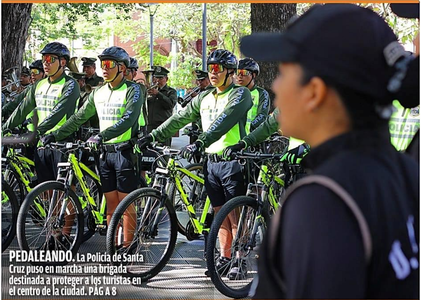
PEDALEANDO. La Policía de Santa Cruz puso en marcha una brigada destinada a proteger a los turistas en el centro de la ciudad. PAG A 8

Con al menos 60 puntos de bloqueo activos y crecientes demandas de sectores movilizados, la Policía Boliviana anunció operativos para despejar todas las carreteras del país con apoyo de las Fuerzas Armadas. Mientras se inician intervenciones en rutas de La Paz, las protestas suben de tono: el magisterio rural advierte radicalización de medidas y la COB ya exige la renuncia del presidente, en medio de llamados oficiales al diálogo y la reconciliación. PÁG A 4