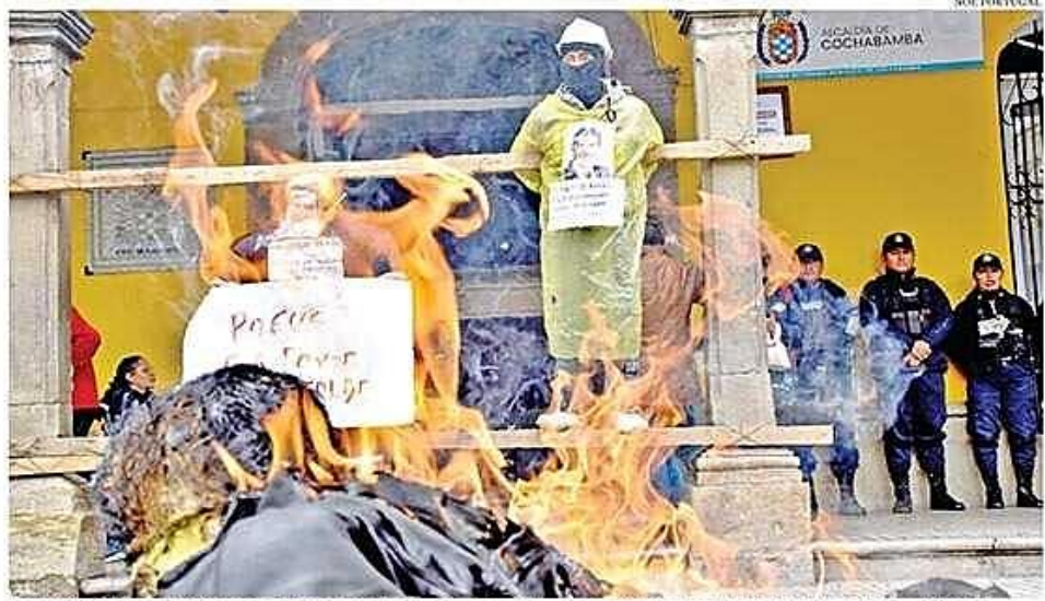
Los movilizados se crucificaron, pintaron carteles con su sangre y quemaron muñecos frente a la Alcaldía, en la Plaza Principal. 2A COCHABAMBA

La Asociación de Constructores de Cochabamba protesta por el incumplimiento municipal respecto a proyectos concluidos en gestiones pasadas.