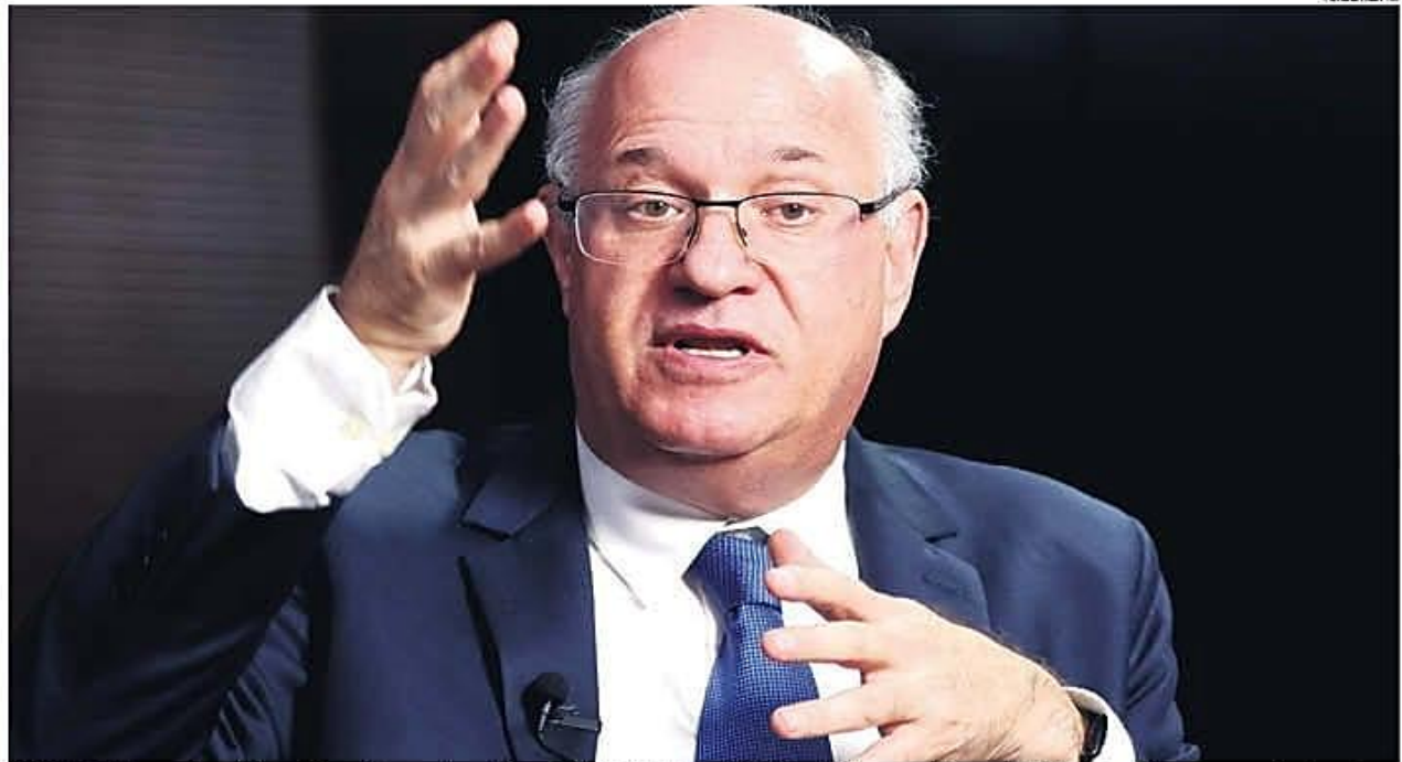
ILAN GOLDFAJN. Regreso: Un presidente del Banco Interamericano de Desarrollo visita Bolivia después de 15 años. Está convencido de que el país tiene potencial para crecer económicamente

JUEVES 15 DE ENERO DE 2026 | EN TODO EL PAÍS $S 8,00