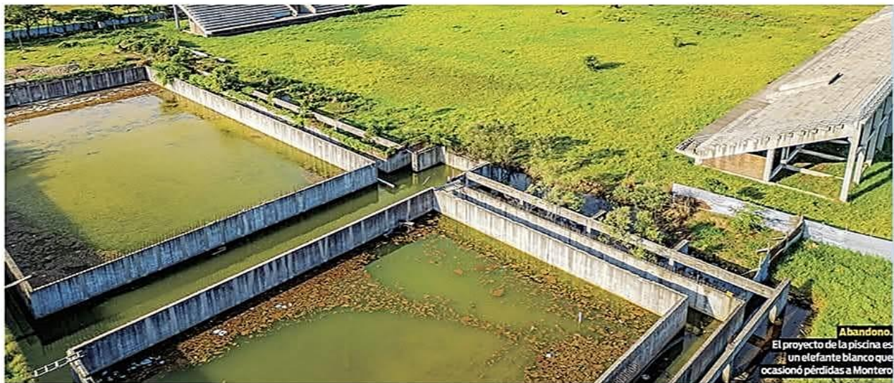
Abandono. El proyecto de la piscina es un elefante blanco que ocasionó pérdidas a Montero

La rescisión del contrato con la constructora en malos términos, impulsada por el ex alcalde Noel Pozo, obligó a pagar los Bs 10 millones. CIUDAD PÁG 3