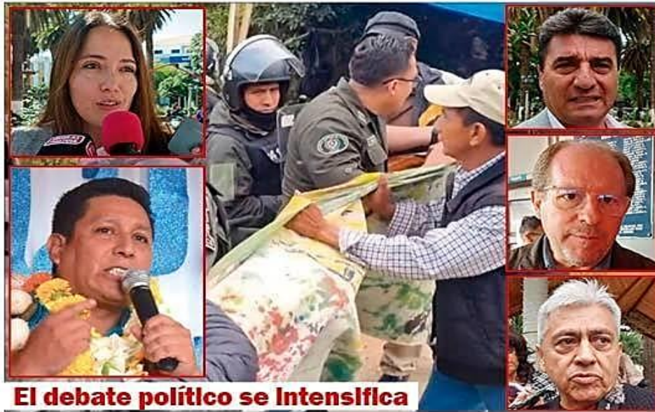
El debate político se intensifica