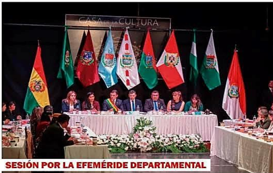
SESIÓN POR LA EFEMÉRIDE DEPARTAMENTAL