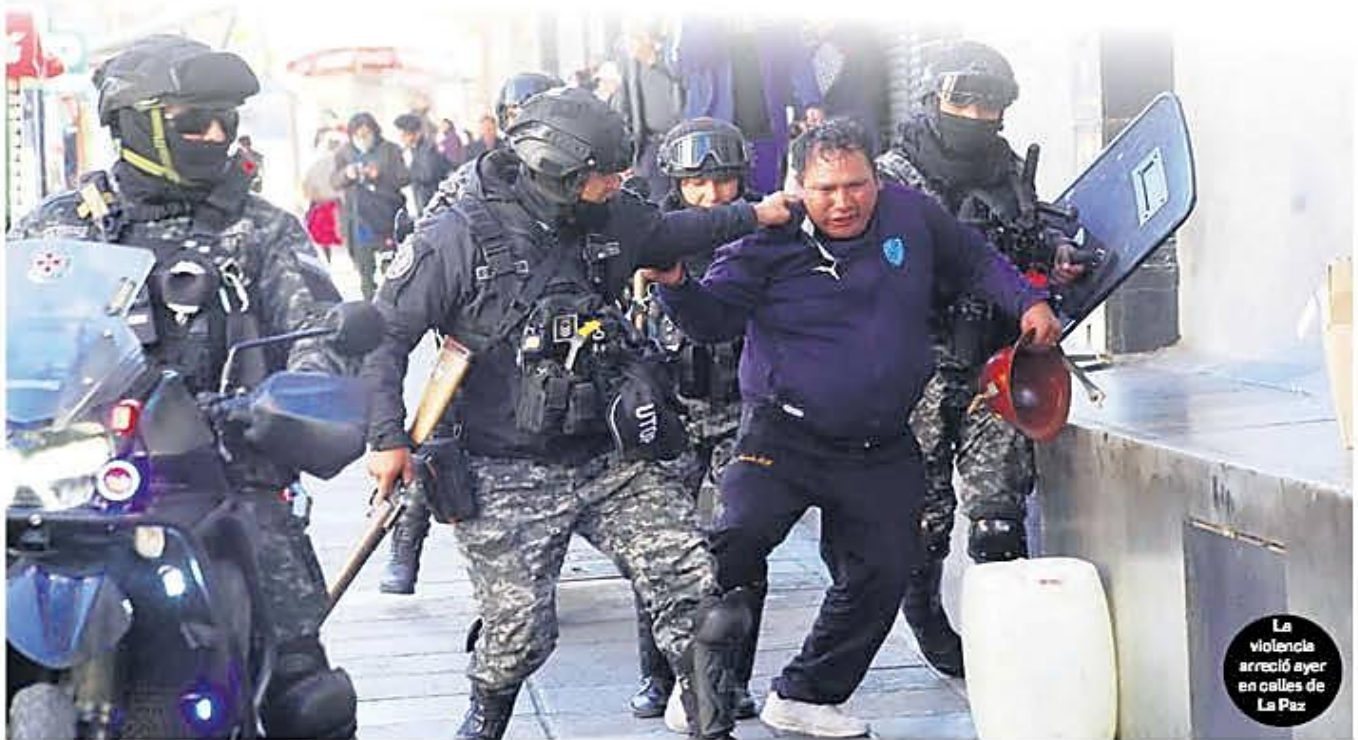
La violencia arreció ayer en calles de La Paz