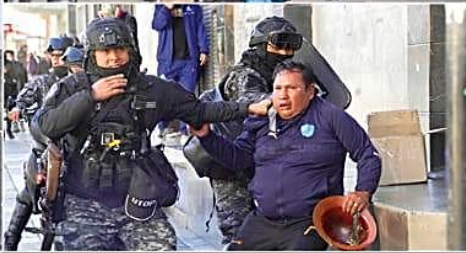
VIOLENCIA. Ayer, en La Paz, hubo enfrentamientos entre afiliados a Fedecomin y maestros rurales con la Policía. Se reportaron al menos cuatro heridos y ocho aprehendidos.