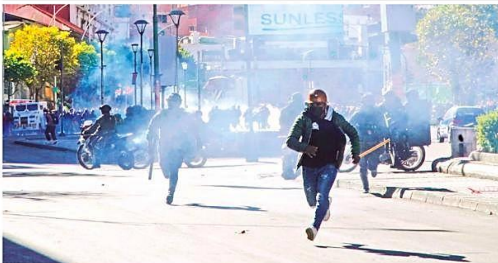
Mineros cooperativistas se enfrentan a la Policía en cercanías de la Plaza Murillo en medio de pedidos de renuncia del presidente Paz.