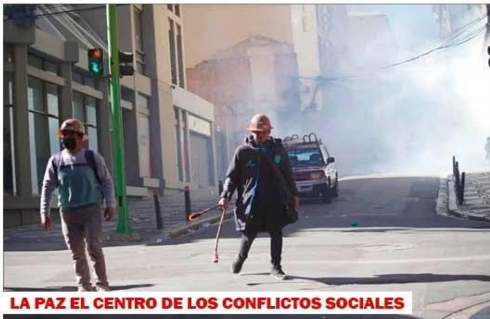
LA PAZ EL CENTRO DE LOS CONFLICTOS SOCIALES