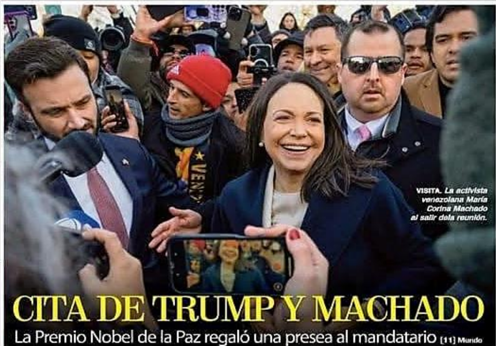
VISITA. La activista venezolana María Corina Machado al salir de la reunión.