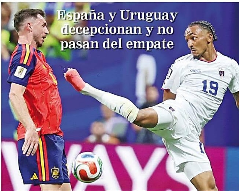
España y Uruguay decepcionan y no pasan del empate

» Los leales a Evo Morales advirtieron que desconocerán cualquier acuerdo con el Gobierno.