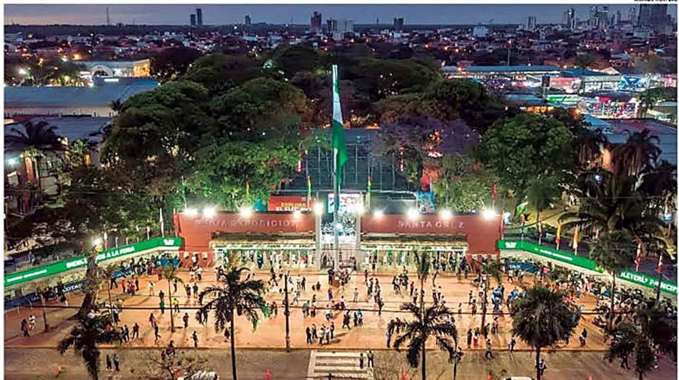
Nuevas propuestas. En 2026 las herramientas tecnológicas serán fundamentales para generar oportunidades, conectar clientes y cerrar negocios

La feria multisectorial más importante de Bolivia y una de las más relevantes de la región prevé romper nuevos récords en septiembre, tanto por la asistencia de público, como por la rueda e intenciones de negocio. PÁGS. 4-5