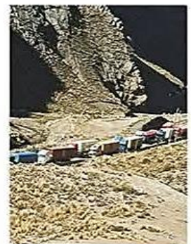
Miles de transportistas están varados en las carreteras sin poder seguir viaje

Desde distintas regiones y sectores se suman las voces para exigir al presidente Rodrigo Paz que de una solución definitiva al conflicto que ya se acerca a los 50 días de movilizaciones y bloqueos. PÁGS-6