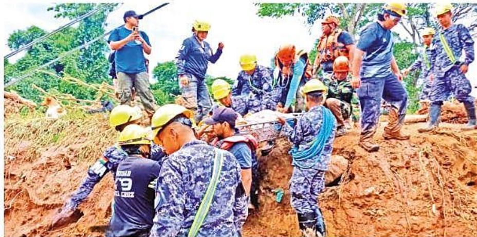
Militares y rescatistas trasladan en una camilla a una de las víctimas atrapadas en el lodo en El Torno, ayer. La escena se repite constantemente.

Daño. La pesadilla que viven los afectados de las inundaciones en Santa Cruz no tiene fin. Las familias lo perdieron todo, los rescates aéreos y en botes continúan. Pág. 6