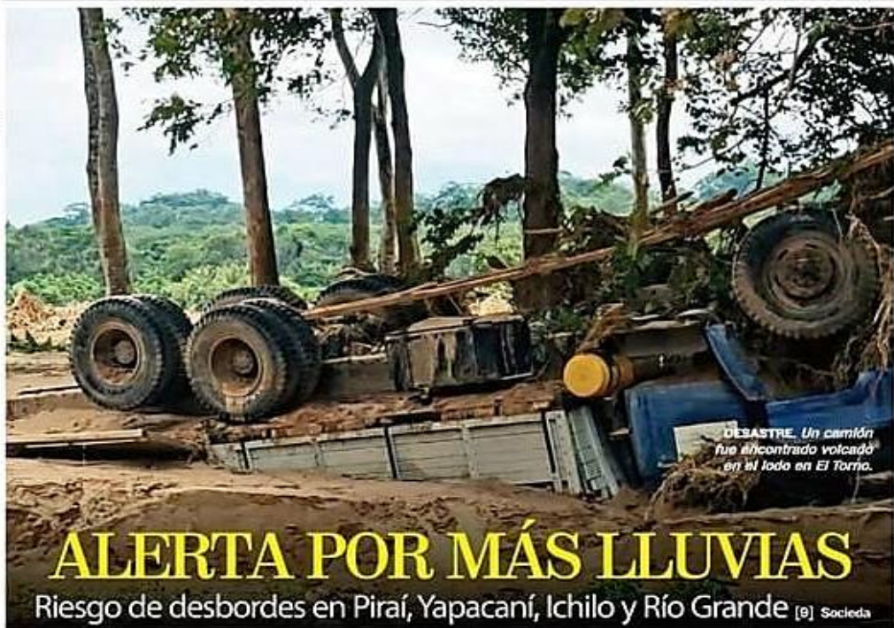
DESASTRE. Un camión fue encontrado volcado en el lodo en El Torro.