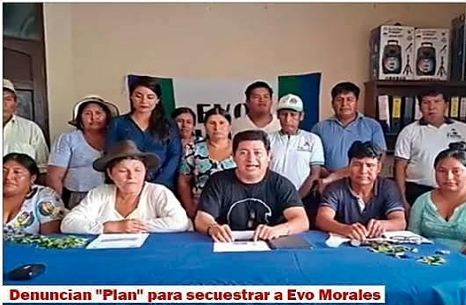
Denuncian "Plan" para secuestrar a Evo Morales