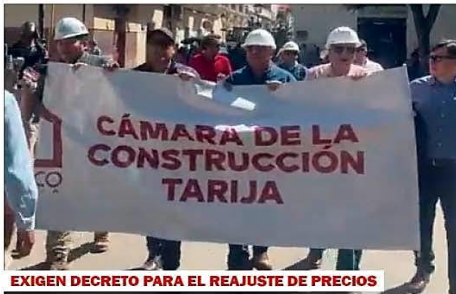
EXIGEN DECRETO PARA EL REAJUSTE DE PRECIOS