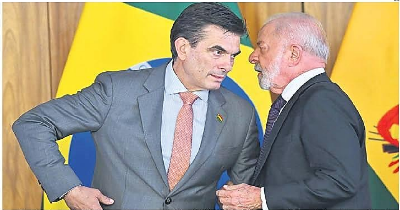
VISITA. El presidente Rodrigo Paz eligió Brasil para realizar su primera visita bilateral. Su homólogo Lula da Silva dijo que se debe potenciar el comercio entre ambas naciones

bolivianos y el gobernador Luis Fernando Camacho también buscan generar oportunidades de negocio en el país vecino. A 2 Y 3