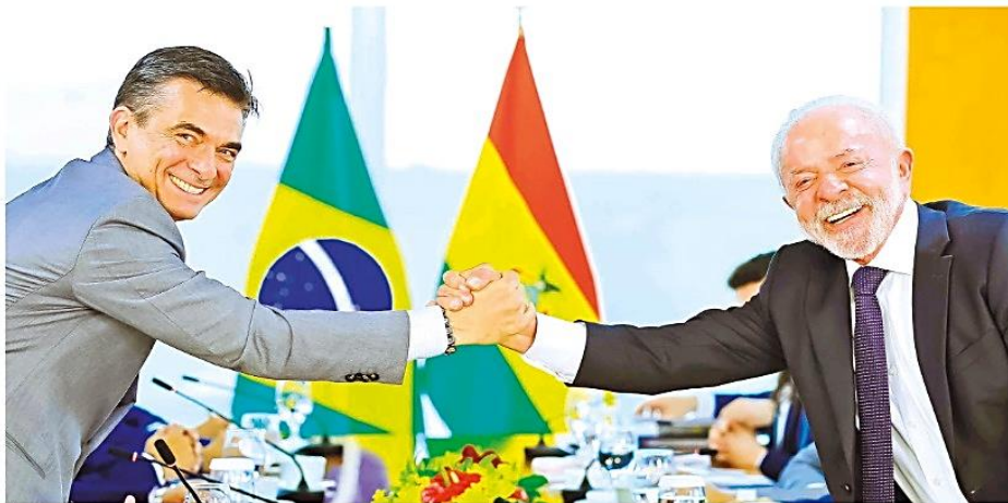
Rodrigo Paz y Luiz Inácio Lula da Silva estrechan sus manos sonrientes durante el encuentro con sus gabinetes en Brasilia, ayer.

Integración. El presidente de Bolivia visitó por primera vez a su par de Brasil con el fin de estrechar la cooperación en áreas como la economía, turismo y energía. Pág. 6