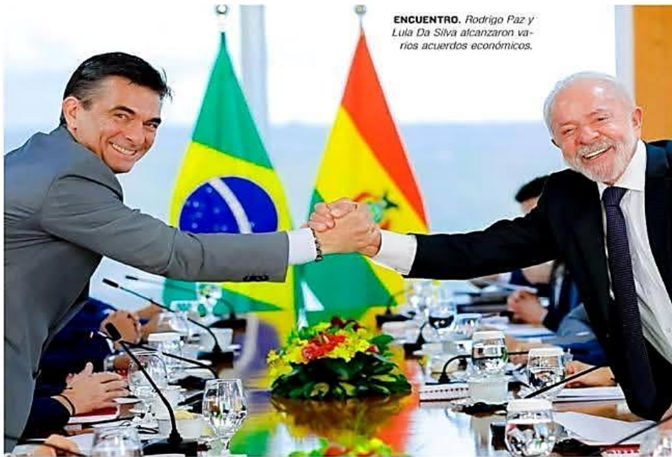
ENCUENTRO. Rodrigo Paz y Lula Da Silva alcanzaron varios acuerdos económicos.

Los pilares son energía, comercio y seguridad