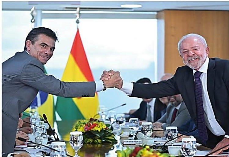
BRASILIA. Los mandatarios estrechando sus manos en la mesa de reuniones instalada ayer en la capital brasileña. Hoy es el turno de los empresarios.

» "Bolivia permanece como una fuente segura y mantiene la condición de mayor proveedor de gas natural para Brasil", dijo Da Silva tras reunirse ayer con Rodrigo Paz. El mandatario boliviano anunció para este año nuevas leyes que tienen relación con hidrocarburos, recursos evaporíticos y el manejo de las tierras raras, entre otras. A/ 7