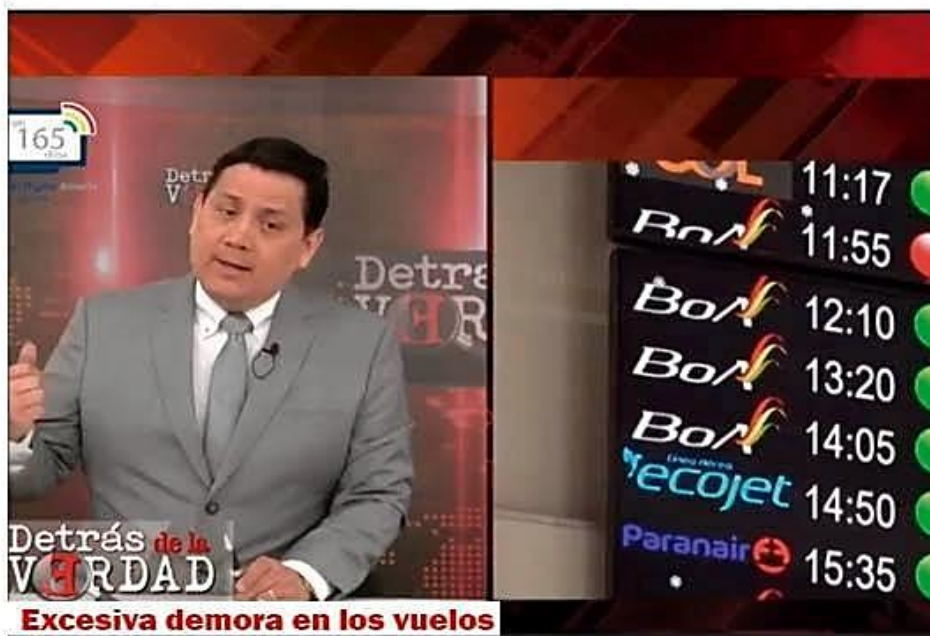
Excesiva demora en los vuelos