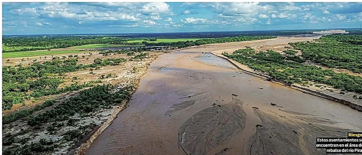
Riesgo. Estos asentamientos se encuentran en el área de rebalse del río Pirai

La riada que golpeó la zona oeste de Montero, puso al descubierto que la mayoría de las urbanizaciones afectadas carecen de aprobación. REGIÓN PÁG 3