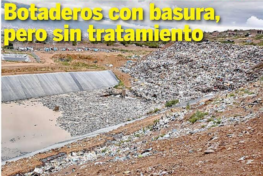
El vertedero a cielo abierto de Quillacollo acumula lixiviados (foto principal) y es foco de atracción de aves (derecha abajo). Un área de la celda donde opera Tunqui (derecha arriba).

Inspeccionan predios de Colcapirhua, Quillacollo y Tunqui