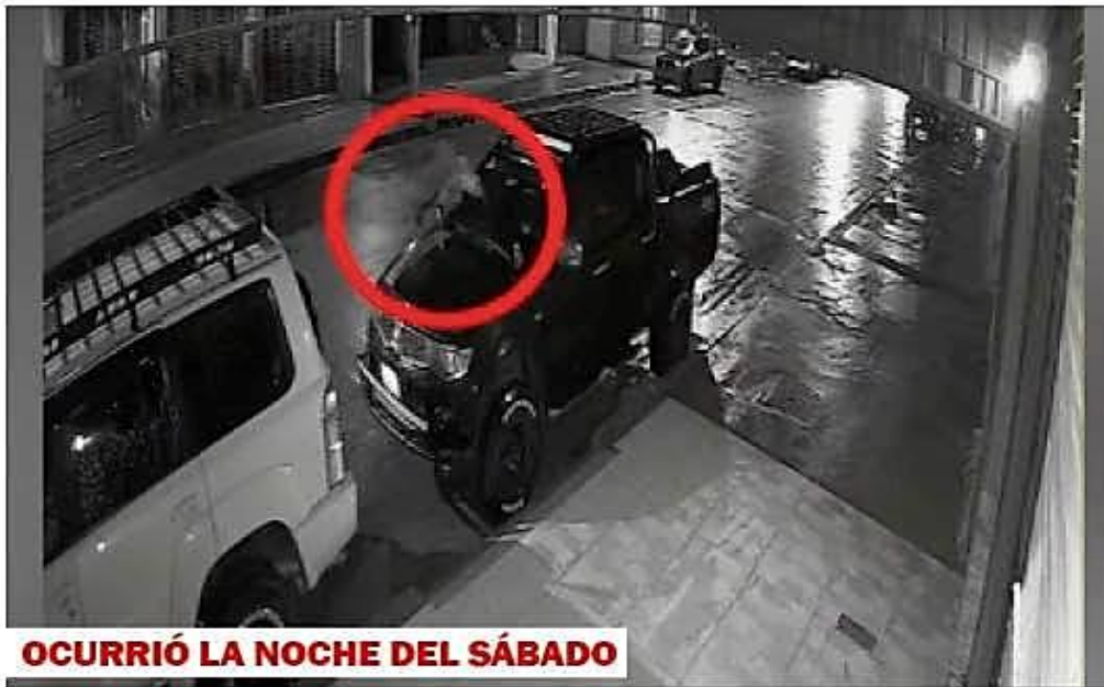
OCURRIÓ LA NOCHE DEL SÁBADO