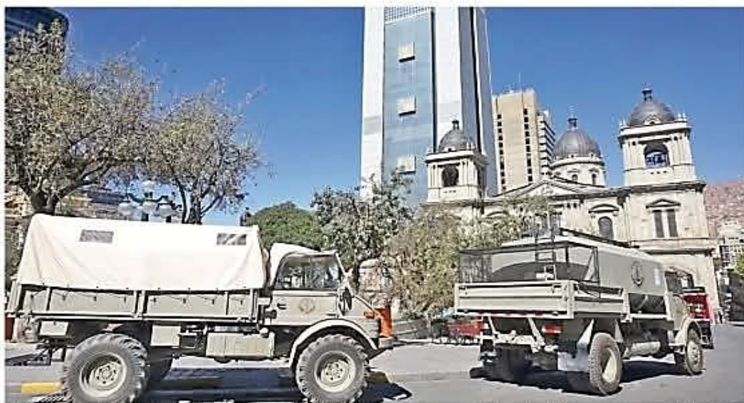
LA PAZ. La seguridad en la Plaza Murillo fue reforzada con la presencia de vehículos blindados de la Armada Boliviana, que custodian las esquinas del 'kilómetro cero' y los accesos al Palacio de Gobierno.