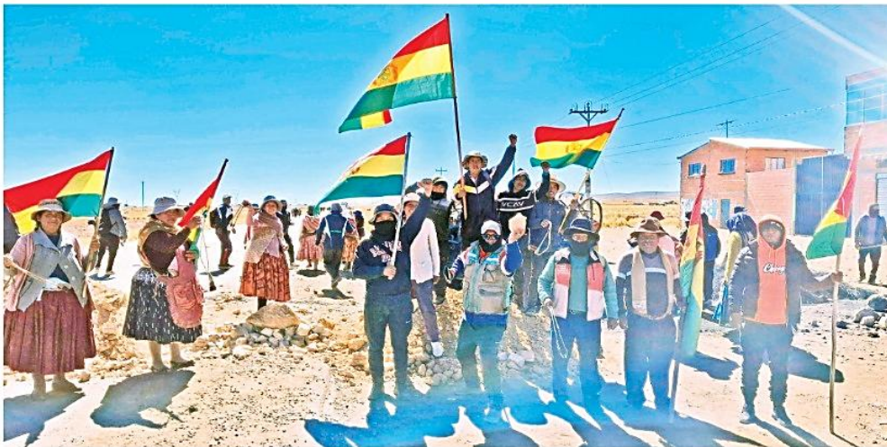
Bloqueadores en una barricada con la tricolor nacional en una carretera del departamento de La Paz, el más afectado por el conflicto.

Dramático. Cientos de choferes pasan penurias en las carreteras bloqueadas y las familias están desesperadas por la escasez de alimentos. EEUU respaldó a Paz. Pág. 3