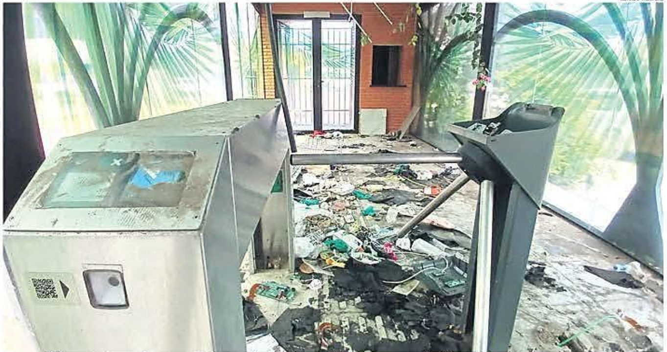
INMUNDICIA. Un lector de tarjetas queda como vestigio de una parada de BRT que nunca llegó a funcionar, en medio de basura, desperdicios humanos y evidencias de saqueo.