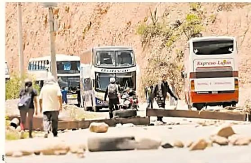
LOS BLOQUEOS DE CAMINOS CONVOCADAS POR LA COB CAUSARON PÉRDIDAS SIGNIFICATIVAS EN EL PAÍS EN LAS ÚLTIMAS SEMANAS.