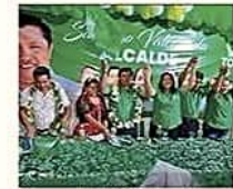
El concejal del MAS buscará la Alcaldía con la agrupación Todos

Los candidatos a la Alcaldía de Montero intensifican su campaña y Valenzuela se suma a la carrera electoral. ELECCIONES PÁG 5