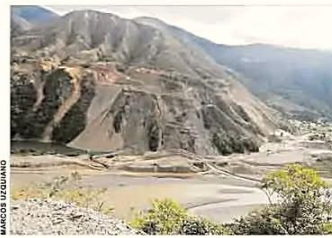
EL RÍO TUICHI, EN EL SECTOR DE LA COMUNIDAD VIRGEN DEL ROSARIO, HACIA DONDE SE DIRIGE LA MAQUINARIA PESADA.

Entre el viernes y sábado de la pasada semana un excavador hidráulico fue trasladado sin la respectiva autorización desde