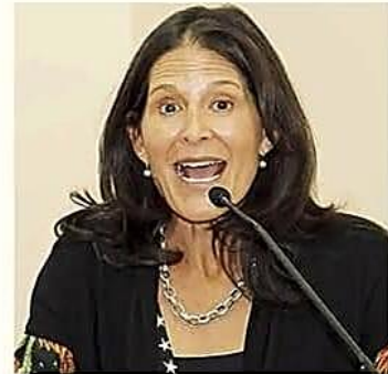
La ministra confirmó el inicio de las clases el 2 de febrero

Oficial. Advierten que el registro de escolares es gratuito y se prohíben condicionamientos económicos para la inscripción directa el alumno. PÁG 3