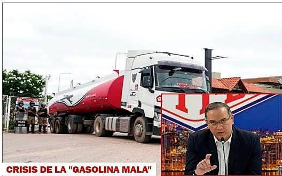
CRISIS DE LA "GASOLINA MALA"