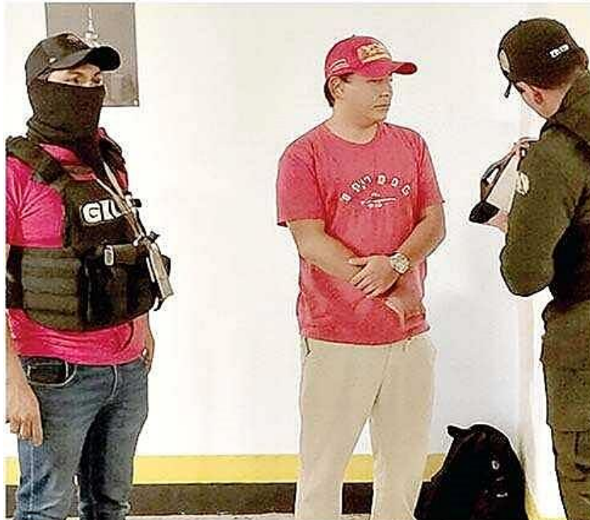
El operativo de captura tuvo lugar en la zona de Equipetrol, en la ciudad capital cruceña.

Según la Fiscalía, la aprehensión se debió a que el investigado se hallaba escondido, lo que suponía un riesgo de obstaculización a las pesquisas.