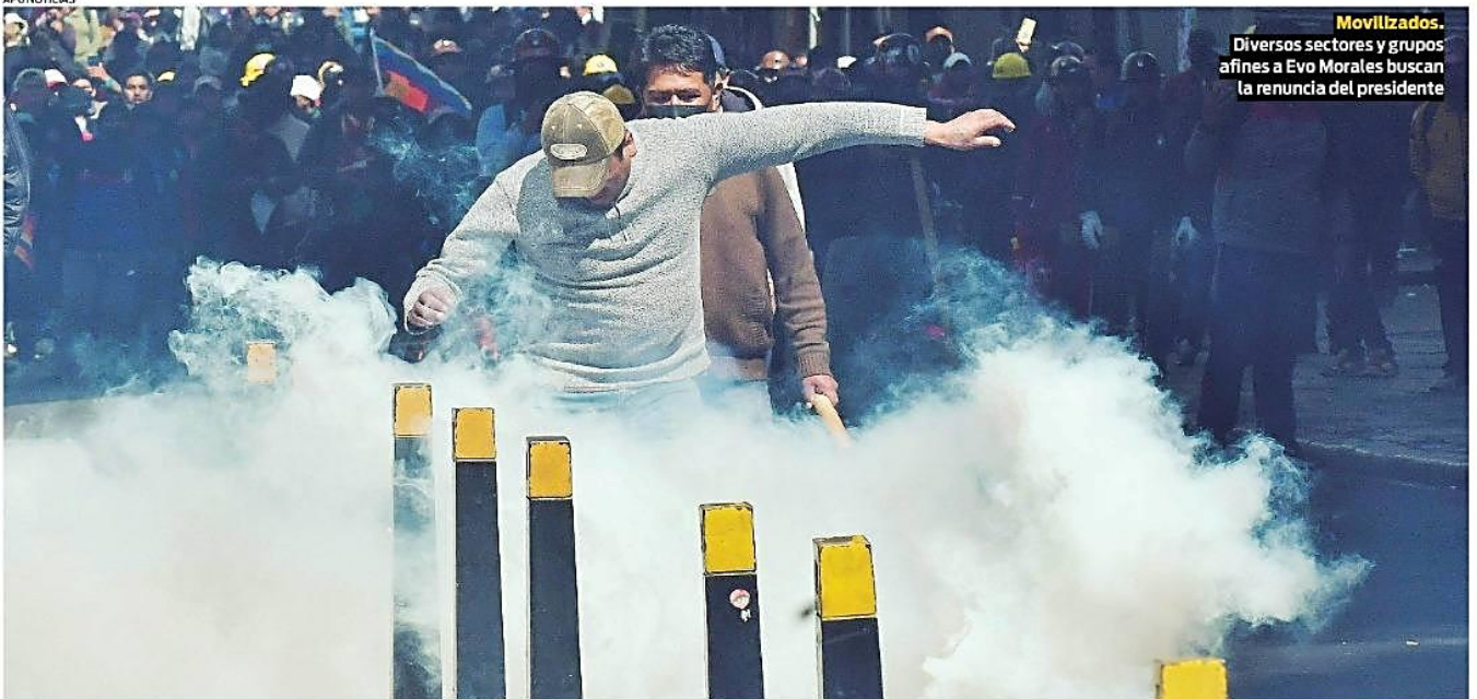
Movilizados. Diversos sectores y grupos afines a Evo Morales buscan la renuncia del presidente