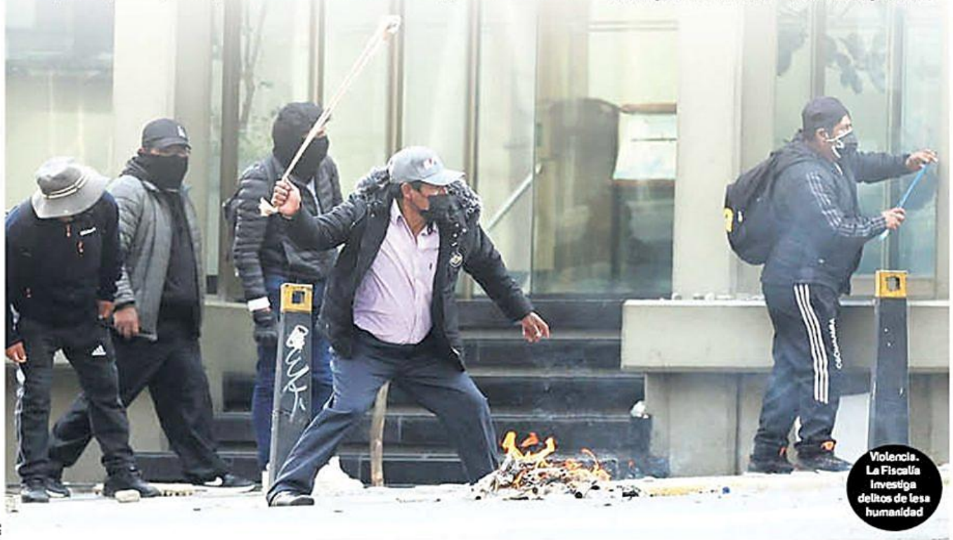
Violencia. La Fiscalía investiga delitos de lesa humanidad

grupos que exigen la renuncia del presidente Rodrigo Paz. La Asamblea de la Cruzada pide al gobierno dictar 'estado de excepción'. A44