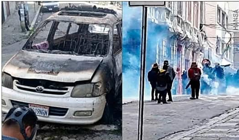
ORDEN DE APREHENSIÓN CONTRA EJECUTIVO DE LA COB