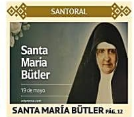
SANTA MARÍA BÜTLER pág. 12

Santa Cruz de la Sierra • Martes 19 de mayo de 2026 • N° 11.876 • 24 páginas • Precio en todo el país Bs 5,00