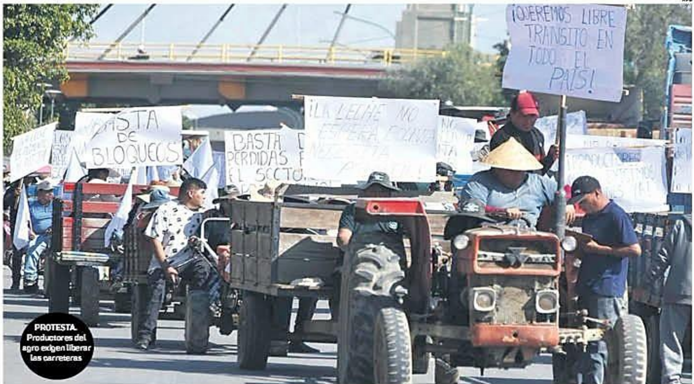
PROTESTA. Productores del agro exigen liberar las carreteras

dos por bloquear. Se viene un feriado largo, sin que se pueda cumplir el objetivo de fomentar el turismo interno. A3-8