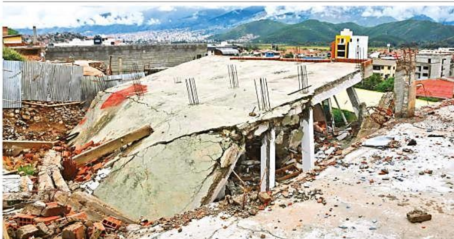
Una de las viviendas que colapsó en la OTB Nuevo Amanecer, en la serranía de Ticti Sur, por los deslizamientos que comenzaron en 2020.