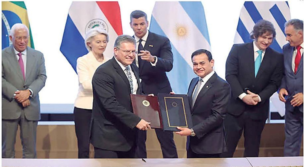
Logro. Tras 25 años de negociaciones, el bloque económico del Mercosur y el de la UE pactaron y formaron un mercado de libre de comercio de más de 700 millones de potenciales compradores

El acuerdo entre el Mercosur y la Unión Europea, encuentra a Bolivia en una posición vulnerable con un aparato productivo poco diversificado y una alta dependencia de las exportaciones primarias. PÁGS. 4-5