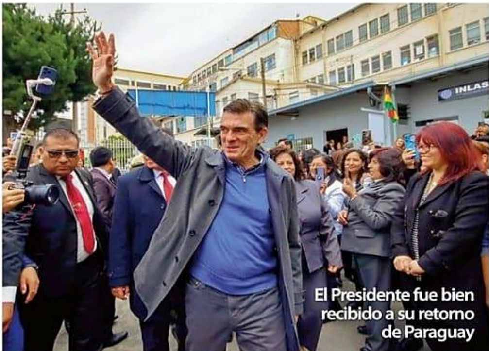
El Presidente fue bien recibido a su retorno de Paraguay