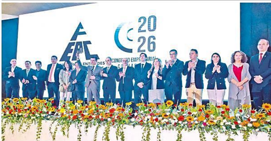
Empresarios y ministros junto al presidente Rodrigo Paz en la foto oficial del Congreso Empresarial 2026 en el campo ferial de Alalay.