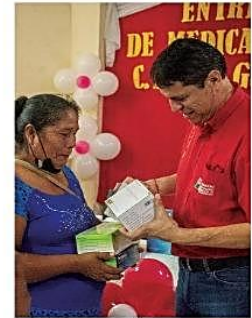
Una buena parte de los recursos de la Alcaldía se destinaron a salud

El 27 de febrero el Ejecutivo como el Legislativo Municipal presentarán una rendición de cuentas públicas de los recursos que fueron manejados en la gestión pasada. PÁG 3