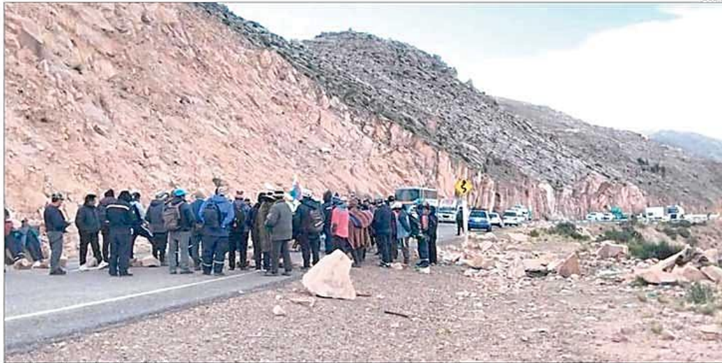
Una de las carreteras bloqueadas en Potosí.

► Se calcula que la economía mundial crecerá dos décimas menos de lo que fue proyectado en enero por el organismo internacional. A-12