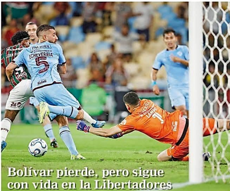
Bolívar pierde, pero sigue con vida en la Libertadores

» En Chuquisaca la medida pierde fuerza, pero los bloqueos en el resto del país perjudican a Sucre.