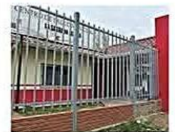
El trabajo no para con la finalidad de mejorar la atención al vecino

La ampliación del centro de salud de la Sagrada Familia, tiene un avance de 90% de las obras que se programaron CIUDAD PÁG 4