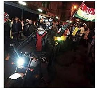
Los ciudadanos se autoconvocaron en tres departamentos

Rechazo. En Sucre, Cochabamba y La Paz, las plataformas ciudadanas salieron a las calles para rechazar los bloqueos y la violencia en el país. PÁG 5